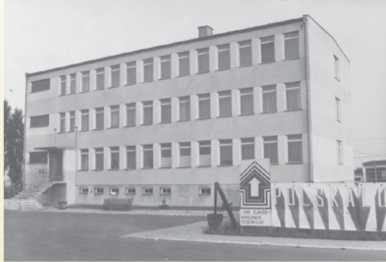
Przedsiębiorstwo Komunalne (PK), lata 80.