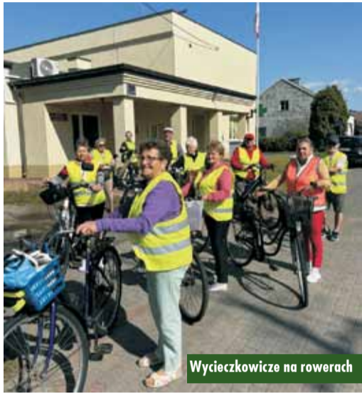
Wycieczkowicze na rowerach

W słoneczne, czerwcowe przedpołudnie grupa seniorów oraz bibliotekarzy wyruszyła na rowerową wyprawę do malowniczej Byczyny. Inicjatywa, zorganizowana przez Gminną Bibliotekę Publiczną w Łęce Opatowskiej z siedzibą w Opatowie,