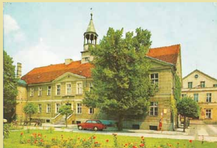
Rynek w Kępnie (pocztówka). W latach 70. o zieleni w mieście dbało PK