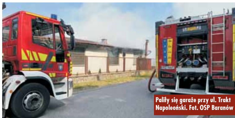
Palły się garaże przy ul. Trakt Napoleński.