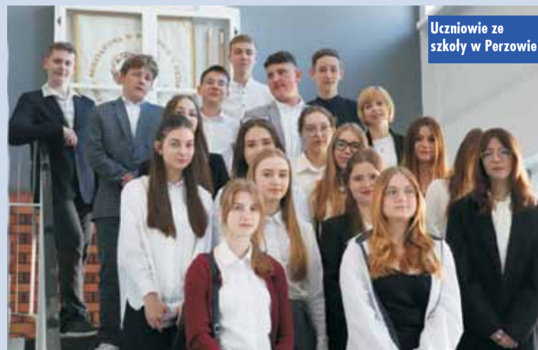
Uczniowie ze szkoły w Perzowie

I Gminny Turniej KGW o Puchar Wójta Gminy Trzcinica