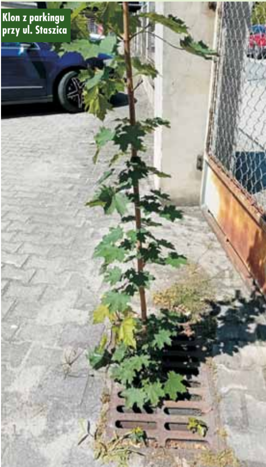
Klon z parkingu przy ul. Staszica

czyszczeń, w tym soli po okresie zimowym, drzewo rośnie. W tym roku przebiło się już przez kratkę ściekową i z niespotykaną siłą pnie się w górę, wypuszczając wciąż nowe, zielone liście. Tym drzewem „herosem” jest klon zwyczajny. Nasionkami klonu są dwa skrzydłaki, tzw. „noski”. Początkowo mają żółtzielony kolor, często z różowym odcieniem, później przebarwiają się na beżowo kiedy dojrzeją. I to takie niepozorne nasionko wpadło do kanału i zakiełkowało, a z niego wyrosło już okazałe drzewo.