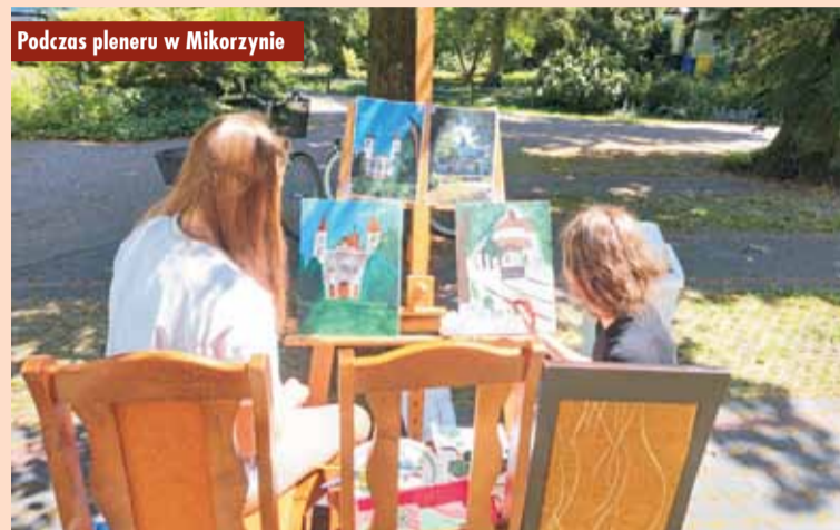
Podczas pleneru w Mikorzynie

- Zachęcamy wszystkich do malowania Sanktuarium św. Idziego i ogrodu. Można to robić na różne sposoby – na żywo, tworząc w plenerze czy w domu – ze zdjęć lub przywołując z pamięci poruszające widoki. Wszyscy autorzy obrazów o Sanktuarium św. Idziego w Mikorzynie mogą zgłosić swoje dzieła do konkursu malarskiego. Jest na to czas! Termin zgłoszeń upływa 22 sierpnia br., a rozstrzygnięcie i