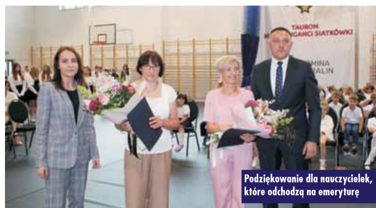
Podziękowanie dla nauczycielek, które odchodzą na emeryturę