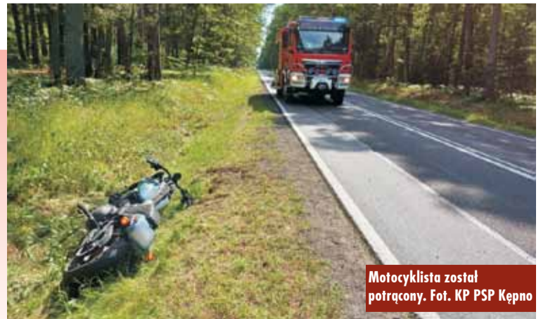
Motocyklista został potrącony.

mercedesa został pobity przez motocyklistów – dodaje mł. asp. A. Wylęga.