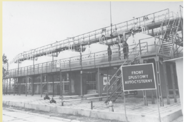
Rozlewnia gazu z PK, lata 80.