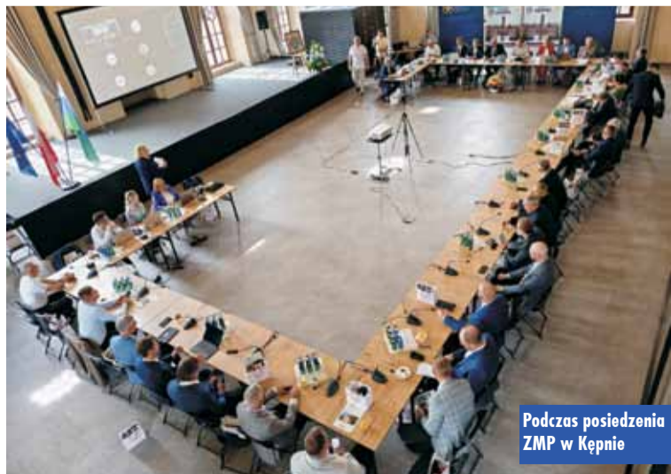
Podczas posiedzenia ZMP w Kępnie