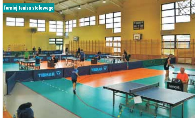
Turniej tenisa stołowego

Równolegle w hali sportowej rozgrywano emocjonujący Turniej Tenisa Stołowego, w którym uczestnicy