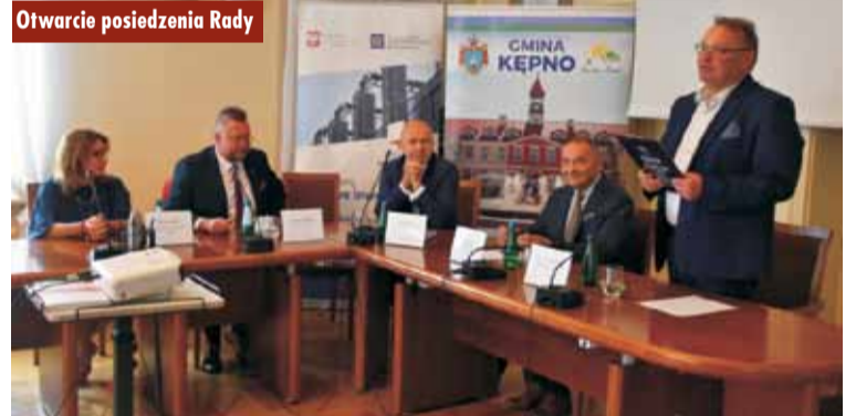
Otwarcie posiedzenia Rady

11 lipca br. w kępińskim ratuszu odbyło się posiedzenie Rady Rozwoju Obszaru Gospodarczego. Spotkanie zorganizował Zarząd Kamiennogórskiej Specjalnej Strefy Ekonomicznej Małej Przedsiębiorczości wraz z Gminą Kępno.