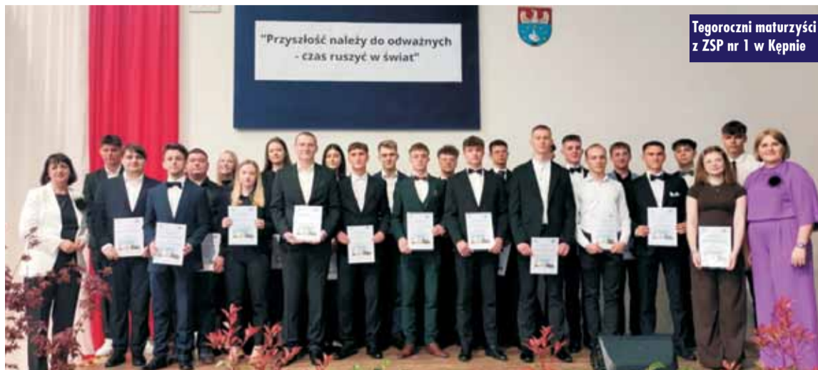
Tegoroczni maturzyści z ZSP nr 1 w Kępnie

Kraj – 80% Wielkopolska – 79 % Powiat Kępiński – 90%