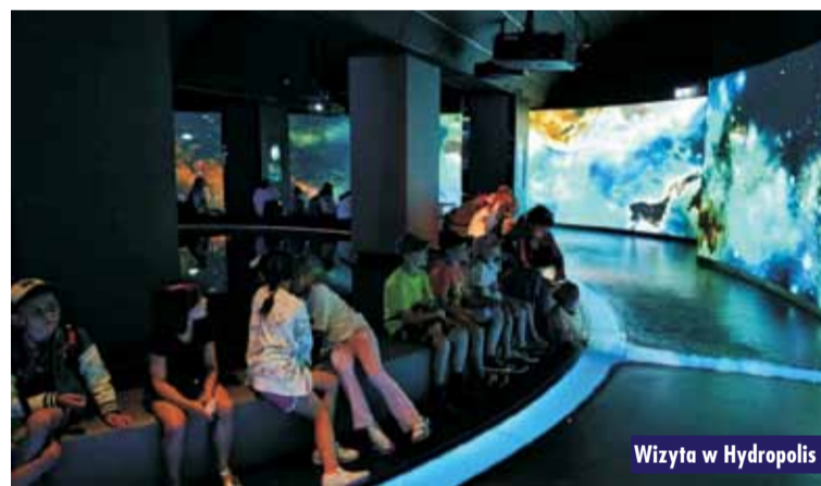
Wizyta w Hydropolis

Wycieczka do Arboretum w Stradomiu Dolnej w ramach letnich atrakcji organizowanych przez Gminę Bralin