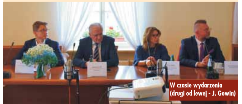
W czasie wydarzenia (drugi od lewej - J. Gowin)