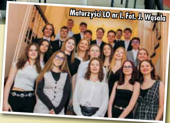
Maturzyści LO nr 1.

Wyniki tegorocznych egzaminów dojrzałości pokazują, że w skali kraju maturzyści poradzili sobie wyraźnie słabiej, niż ich koledzy z ubiegłego roku (84,1% zdanych matur). Wiele więcej jest też matur niekwalifikujących się do poprawki. Kępińscy maturzyści zdali maturę w 90%, czyli lepiej niż w Polsce i Wielkopolsce.