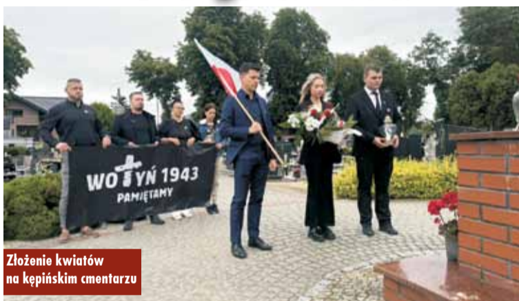
Złożenie kwiatów na kępińskim cmentarzu

11 lipca br., w Narodowy Dzień Pamięci Ofiar Ludobójstwa na obywatelach II Rzeczypospolitej, członkowie oraz sympatycy Nowej Nadziei Kępno i Konfederacji symbolicznie upamiętnili ofiary tragicznych wydarzeń sprzed ponad 80 lat. Pod krzyżem zapalono znicz oraz złożono kwiaty – w geście ciszy, zadumy i szacunku dla tych, którzy zginęli.