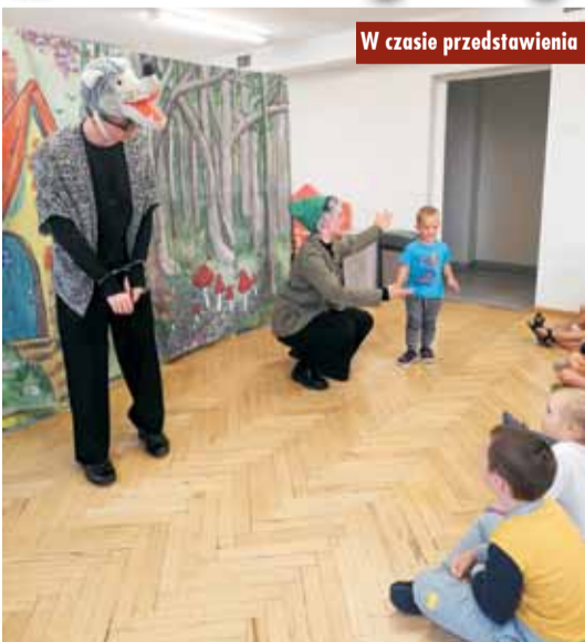
W czasie przedstawienia

8 lipca br. Biblioteka Publiczna w Perzowie zorganizowała wyjątkowe wydarzenie dla najmłodszych mieszkańców miejscowości