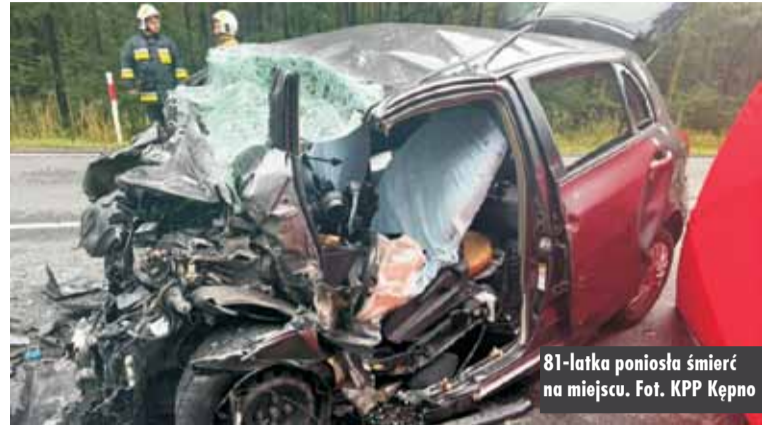
81-latką poniosła śmierć na miejscu.

9 lipca br., około godziny 16.30, na 440. kilometrze drogi krajowej nr 11 na odcinku Kępno-Ostrzeszów doszło do tragicznego w skutkach wypadku.