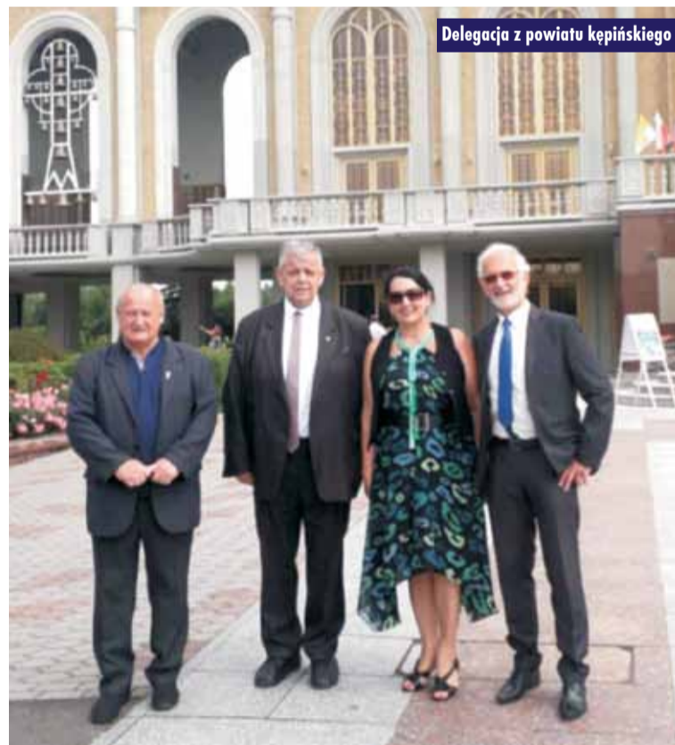
Delegacja z powiatu kępińskiego