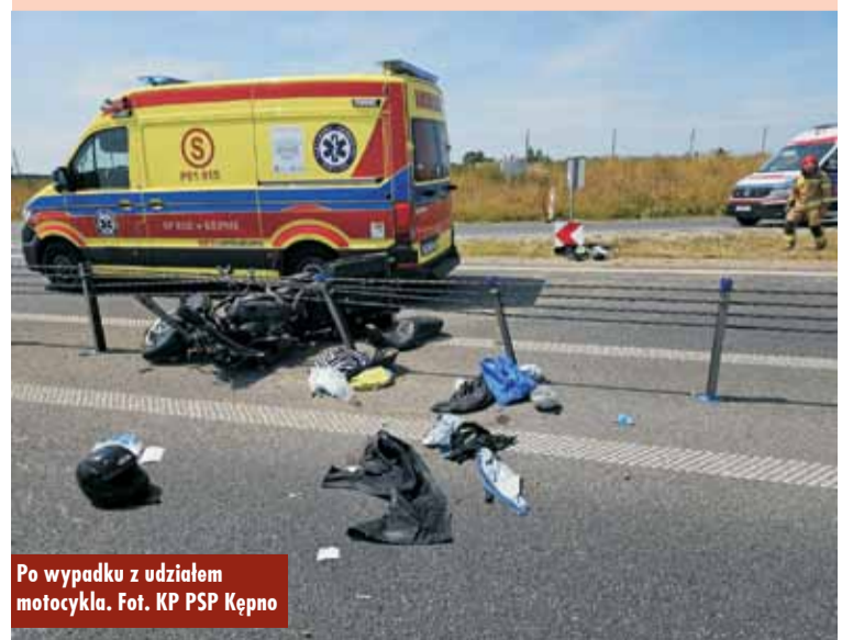
Po wypadku z udziałem motocykla.