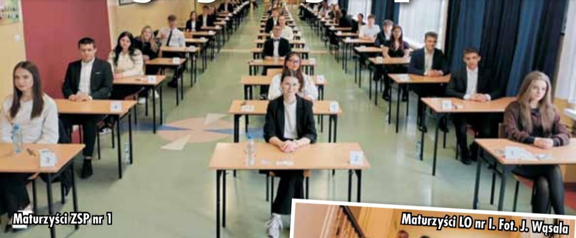
Maturzyści ZSP nr 1