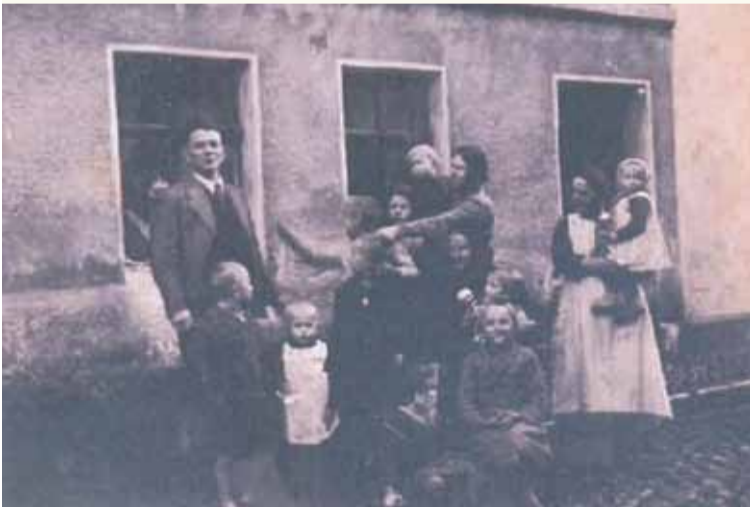
Zdjęcie rodzinne 1964 r.