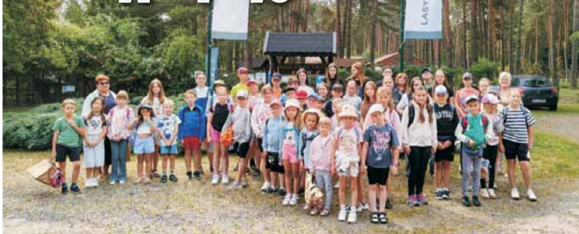
Atrakcje w Arboretum