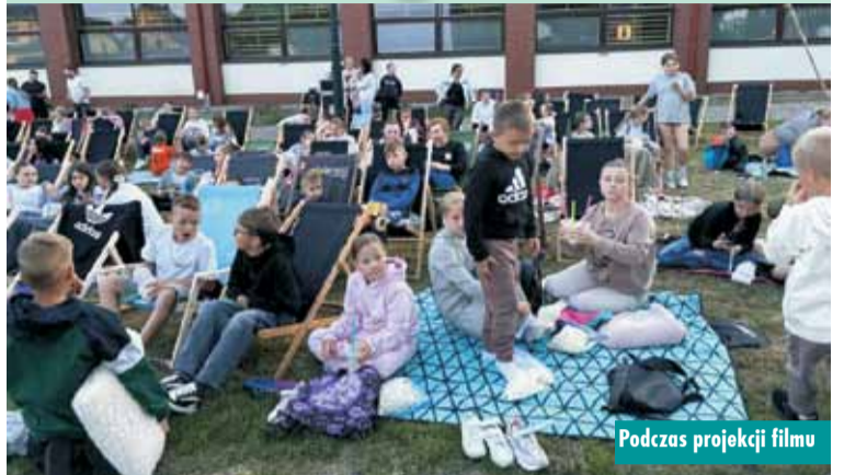
Podczas projekcji filmu

4 lipca br. Gminna Biblioteka Publiczna w Łęce Opatowskiej z siedzibą w Opatowie zaprosiła mieszkańców gminy na seans filmowy w plenerze. Na placu przed Rządówką w Łęce Opatowskiej wyświetlony został film rodzinny pt. „O czym marzą zwierzęta”.