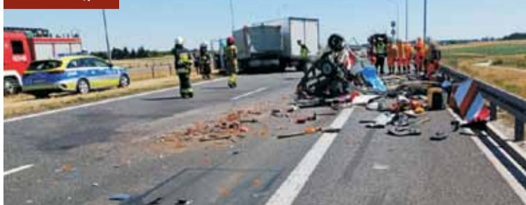
Po wypadku na S8.