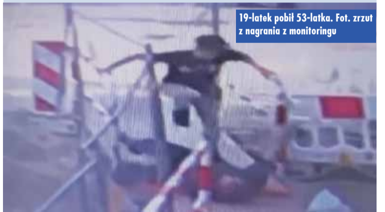
19-latek pobija 53-latkę. Fot. zrzut z nagrania z monitoringu

Przesłuchany w charakterze podejrzanego 19-latek przyznał się do popełnienia zarzucanego mu czynu, potwierdził, że był w sklepie, potwierdził także, iż uderzył oraz kopnął podejrzanego, ponieważ zdenerwowały go słowa, które miał od niego usłyszeć.