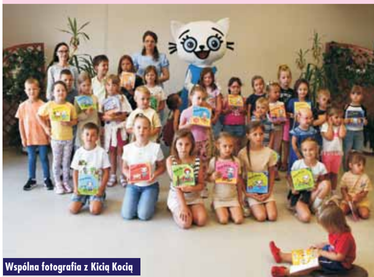
Wspólna fotografia z Kicią Kocią