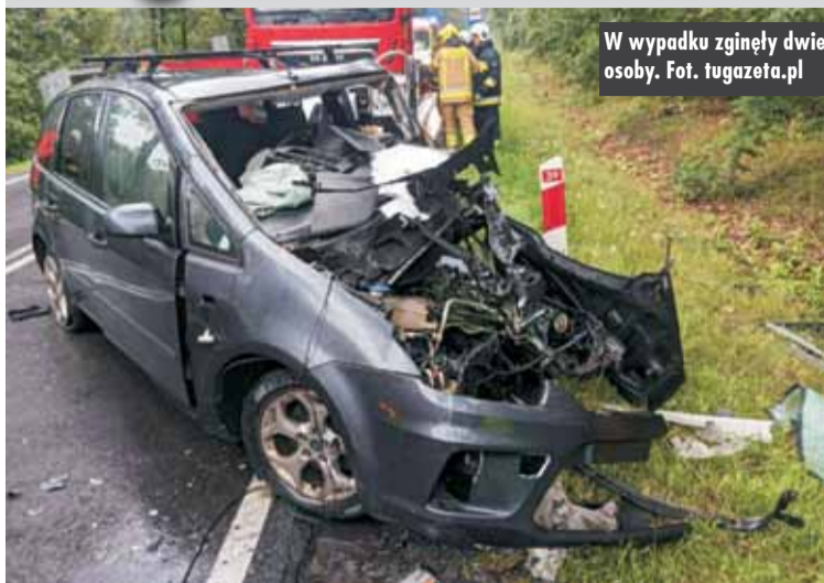
W wypadku zginęły dwie osoby.

28 lipca br., tuż po godzinie 8.00, na 101. kilometrze drogi krajowej nr 39 w Piotrówce doszło do tragicznego w skutkach wypadku z udziałem dwóch samochodów osobowych, którymi podróżowały łącznie trzy osoby.