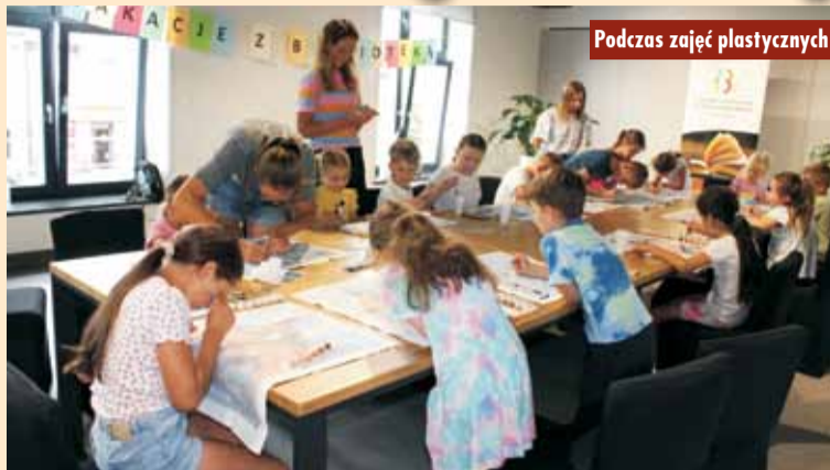
Podczas zajęć plastycznych

24 lipca br. w Gminnej Bibliotece Publicznej w Baranowie odbyły się zajęcia plastyczne z cyklu „Biblioart”, które przyciągnęły najmłodszych miłośników sztuki i kreatywności. Uczestnicy mieli okazję zanurzyć się w świecie kolorów i kształtów, odkrywając radość z malowania po numerach na płótnie. Dzieci z zapałem