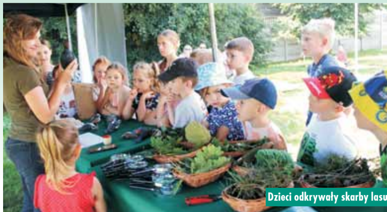
Dzieci odkrywały skarby lasu

Baranów stawia na elektromobilność. Na mocy umowy podpisanej 24 lipca br. zamontowane zostaną trzy stacje ładowania samochodów elektrycznych