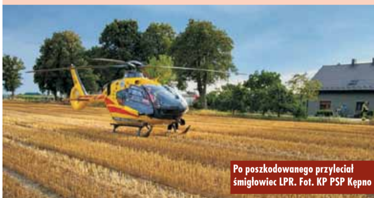
Po uszkodzonego przyleciał śmigłowiec LPR.

Tragiczny w skutkach wypadek z udziałem dwóch samochodów osobowych na drodze krajowej nr 39 w Piotrówce