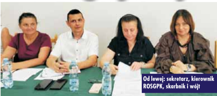
Od lewej: sekretarz, kierownik ROSGPK, skarbnik i wójt

Rada Gminy wyraziła zgodę na zawarcie porozumienia pomiędzy Gminą Perzów a Gminą Bralin w zakresie przekazania przez Gminę Perzów Gminie Bralin zadania polegającego na zapewnieniu uczniom niepełnosprawnym, zamieszkałym na terenie gminy Perzów, bezpłatnego transportu i opieki w czasie przewozu.