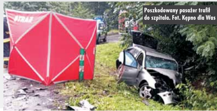
Poszkodowany pasażer trafił do szpitala.