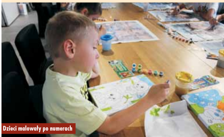
Dzieci malowały po numerach

tworzyły niepowtarzalne wzory na powierzchni płótna. Dzięki obrazom z numerkami mogli nie tylko ćwiczyć malowanie i polepszyć kreatywność, precyzję ruchów, ale też spędzić przyjemnie czas i stworzyć coś pięknego. Zajęcia pozwoliły dzieciom odkryć nowe umiejętności, była to również dobra okazja do sprawdzenia swojej wyobraźni i znakomity trening zręczności manualnej. Wymagało to skupienia i precyzji, ale efekt końcowy zachwyił wszystkich. Ukończony obraz będzie piękną ozdobą i pamiątką z „Wakacyjnej biblioteki”.