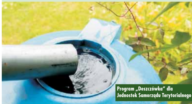
Program „Deszczówka” dla Jednostek Samorządu Terytorialnego

W bieżącej edycji programu JST mogły ubiegać się o dofinansowanie w wysokości do 150 tysięcy złotych lub 80% poniesionych kosztów w ramach jednego zadania. Każdy wnioskodawca mógł złożyć maksymalnie dwa wnioski obejmujące budowę systemów magazynowania i rozprządzenia wody deszczowej. Dzięki instalacji zbiorników możliwe jest zmagazynowanie rocznie około 32 800 m 3 wody i nawodnienie około 550 000 m 2 terenów zielonych. Inwestycje zrealizowane w 2025 r. pozwolą zebrać kolejne 8 965 m 3 wody i nawodnić 74 373 m 2 terenów zielonych. Oprac. m