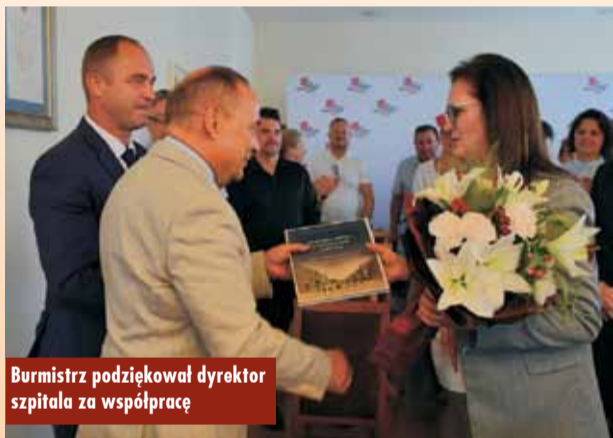
Burmistrz podziękował dyrektor szpitala za współpracę

Radni zdecydowali również o zabezpieczeniu 110 tys. zł na zakup samochodu osobowego typu SUV w wersji oznakowanej dla Komendy Powiatowej Policji w Kępnie. 164 tys zł przeznaczono dla SP ZOZ Kępno na