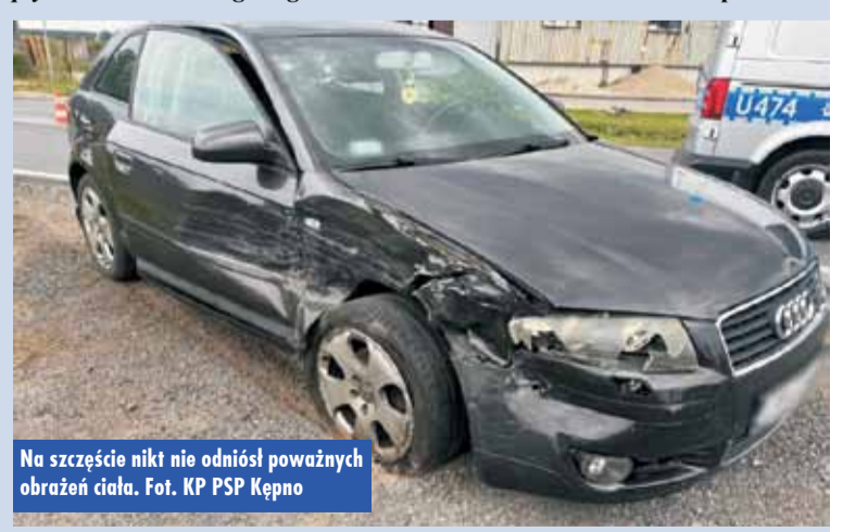
Na szczęście nikt nie odniósł poważnych obrażeń ciała.