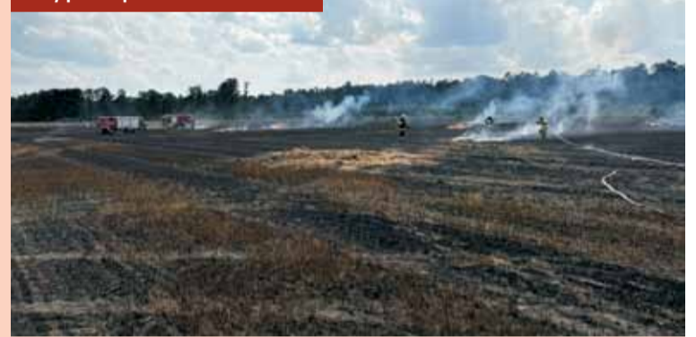
W akcji gaśniczej udział brało 11 zastępów straży pożarnej.