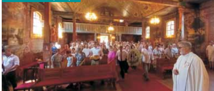
Złożenie wieńców dożynkowych

razeni mieszkańcy zwrócili się więc w błagalnej modlitwie do Matki Bożej Grębanińskiej, prosząc o pomoc.