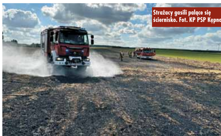
Strażacy gasili palące się ściernisko.

Pozostałe zdarzenia związane były z usuwaniem plamy oleju na drodze, pomocy Straży Miejskiej w złapaniu dzikiego zwierzęcia oraz udzieleniu kwalifikowanej pierwszej pomocy dwóm osobom. Oprac. KR