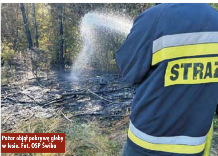
Pożar objął pokrywę gleby w lesie.

doprowadziło do jego całkowitego ugaszenia. Po zakończonych działaniach gaśniczych miejsce zdarzenia dokładnie zwilżono wodą w celu wyeliminowania możliwości ponownego rozwoju pożaru – relacjonuje oficer prasowy KP PSP Kępno, kpt. Jakub Sobczak . Oprac. KR