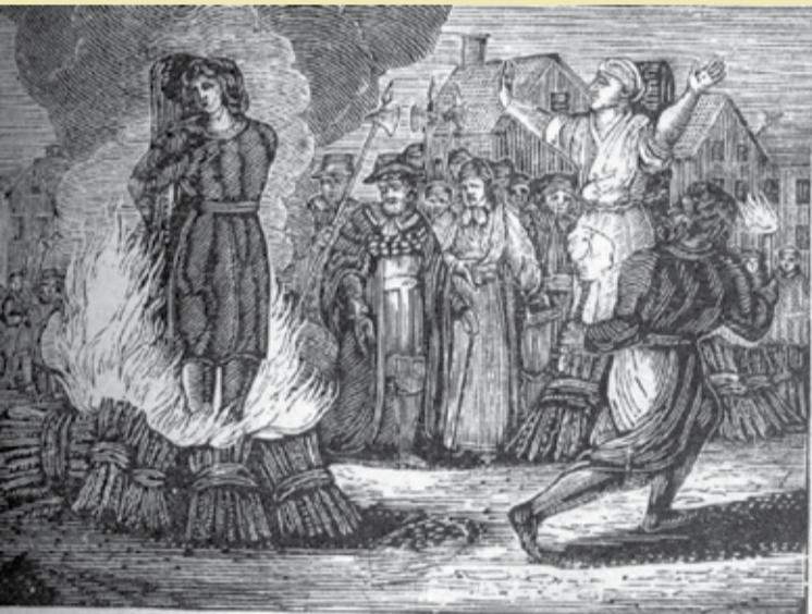
Palenie czarownic - rycina

Analiza kryzysowych scenariuszy epoki wczesnonowożytnej w kontekście związku przyczynowo-skutkowego pozwala wyróżnić następującą systematykę: niekorzystne zjawiska pogodowe – nieurodzaje – wzrost cen – głód – epidemie oraz towarzyszący im gwałtowny wzrost dysproporcji społecznych, który