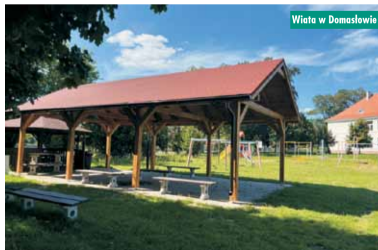
Wiata w Domasławie

Drodzy Czytelnicy, „Tygodnik Kępiński” można znaleźć także w internecie. Serdecznie zapraszamy na stronę www.tygodnikkepinski.pl oraz na Facebook pod adres www.facebook.com/tygodnikkepinski