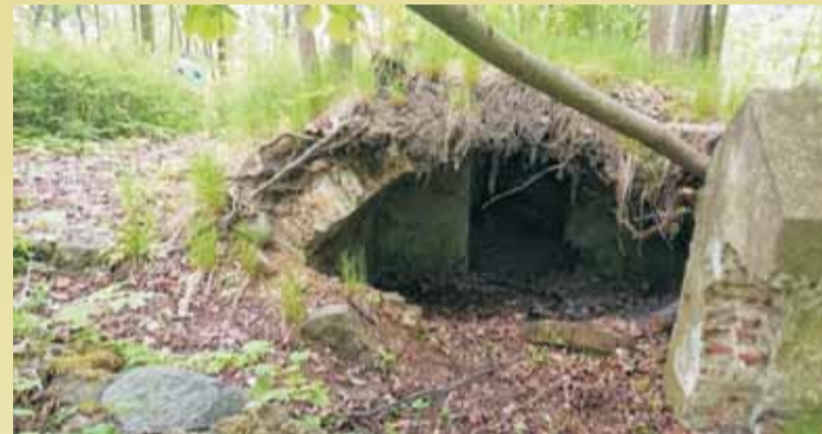
Miejsce więzienia czarownic w Doruchowie w 1775 r.

by z wyższych sfer były traktowane z preferencją, osoby biedne pełniły funkcję służebną i często nie miały prawa uczestniczyć w spożywaniu posiłku. W związku z tym zakres pełnionych obowiązków podczas sabatu również był zróżnicowany i odzwierciedlał ówczesną hierarchię społeczną.