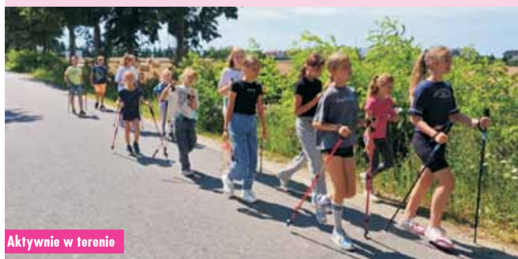
Aktywnie w terenie