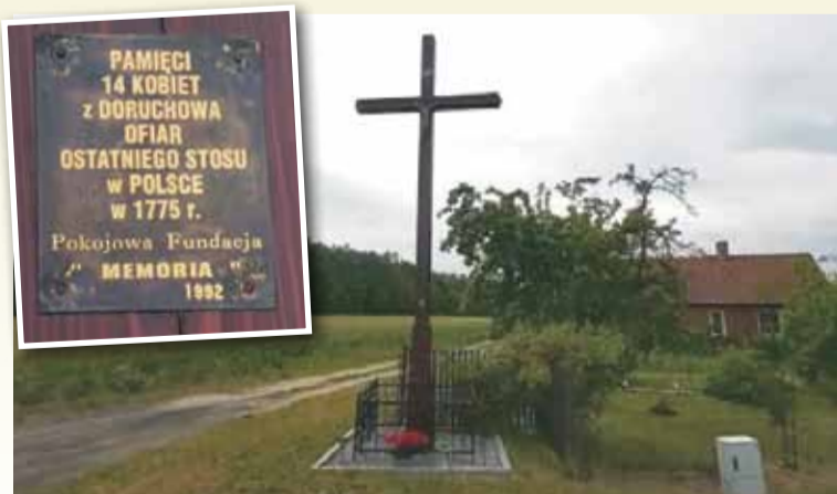
Krzyż w Doruchowie upamiętnia ostatni w Polsce proces o czary, który miał miejsce w 1775 r. Wówczas 14 kobiet zostało skazanych i spalonych na stosie. Krzyż znajduje się na Wzgórzu Czarownic, przy drodze z Doruchowa do Kępna, i jest symbolem tego tragicznego wydarzenia

Z tego wynika także fakt, że czarownice i ich domniemane ofiary łączyły bliskie relacje sąsiedzkie lub