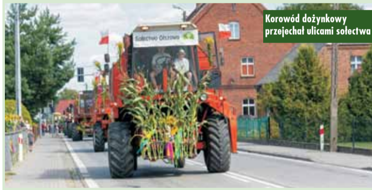
Korowód dożynkowy przejechał ulicami sołectwa

Tegoroczne dożynki były kolejnym, pięknym Świętem Plonów w naszej miejscowości pełnym radości, wspólnej zabawy i wdzięczności za trud rolniczej pracy. Oprac. KR