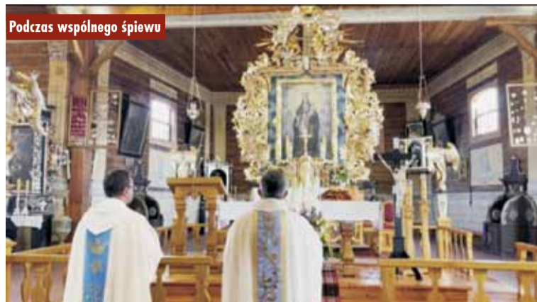
Podczas wspólnego śpiewu