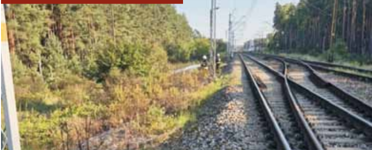
Pożar przy nasypie kolejowym w Domaninie.

Od 15 do 17 sierpnia br. dyżurni Stanowiska Kierowania Komendanta Powiatowego Państwowej Straży Pożarnej w Kępnie otrzymali zgłoszenia o zdarzeniach wymagających interwencji jednostek ochrony przeciwpożarowej. 15 sierpnia br. w Domaninie doszło do pożaru trawy na nasypie kolejowym. 16 sierpnia br. w Biadaskach miał miejsce pożar ścierniska, podobnie jak dzień później w Darnowcu. - W każdym z tych zdarzeń działania strażaków polegały na zabezpieczeniu miejsca zdarzenia oraz podaniu dwóch prądów wody na