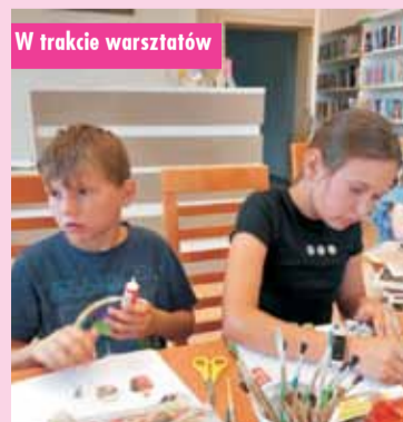
W trakcie warsztatów

GMINNA BIBLIOTEKA PUBLICZNA W ŁĘCE OPATOWSKIEJ Z SIEDZIBĄ W OPATOWIE ZAPRASZA NA: