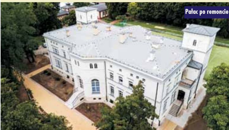
Pałac po remoncie

Późnoklasycystyczny budynek wzniesiony w latach 1840-1850 na planie prostokąta, prawie idealnie w osi W-E, fasadą zwrócony na północ, podpiwniczony, piętrowy z mezzaninem, z 9-osiową fasadą, po bokach której znajdują się dwie trójkondygnacyjne, alkierzowe wieże. Pośrodku fasady portyk kolumnowy, dźwigający belkowanie i trójkątny fronton. Wejście poprzedzone szerokimi schodami, ujętymi stopniowanym murkiem. Pałac Wężyków, bo o nim mowa, już 1 września br. powita swoich uczniów w zupełnie odświeżonej odsłonie.