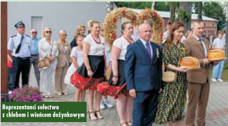
Reprezentanci sołectwa z chlebem i wieńcem dożynkowym

17 sierpnia br. Olszowa rozbrzmiewała radością i świętowaniem podczas dożynek wiejskich, które przyciągnęły licznych mieszkańców oraz gości z sąsiednich miejscowości. Uroczystość rozpoczęła się uroczystą mszą świętą, podczas której złożono dary oraz zaprezentowano misternie wykonany wieńiec dożynkowy, przygotowany przez panie z Koła Gospodyń Wiejskich w Olszowie.