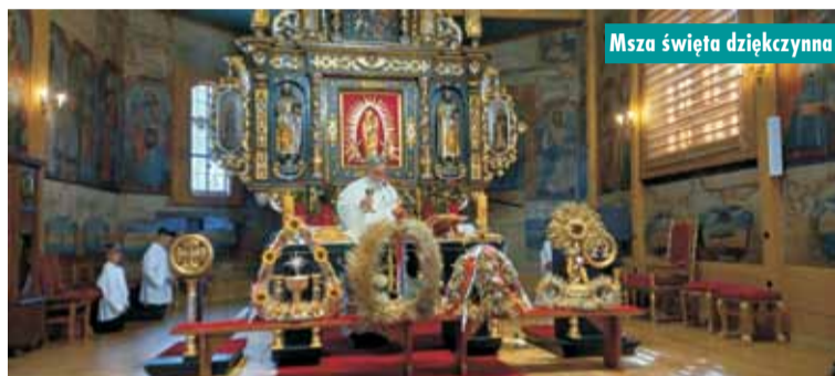
Msza święta dziękczynna