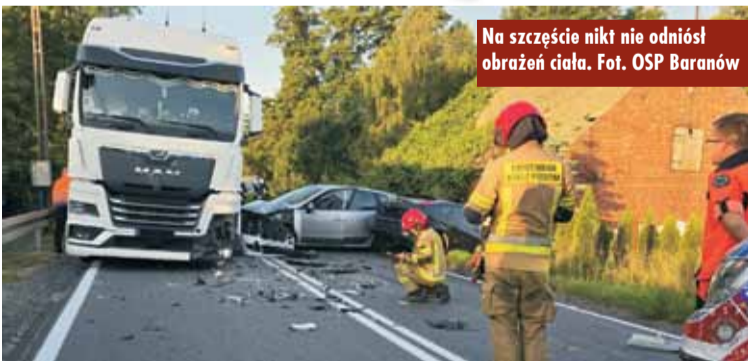
Na szczęście nikt nie odniósł obrażeń ciała.

13 sierpnia br., o godzinie 6.25, na drodze krajowej nr 39 w Mroczeniu doszło do kolizji. Przybyli na miejsce strażacy zastali dwa pojazdy osobowe oraz jeden ciężarowy po zderzeniu. - Uczestnicy zdarzenia w chwili przybycia jednostek ochrony przeciwpożarowej znajdowali się