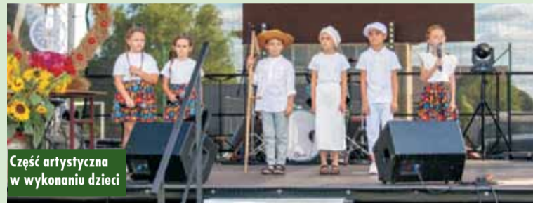
Część artystyczna w wykonaniu dzieci

Na uczestników święta czekało wiele dodatkowych atrakcji – dmuchane zamki, rodeo, kule na wodzie, przejażdżka ślizgaczem po trawie, a także pyszności przygotowane przez Koło