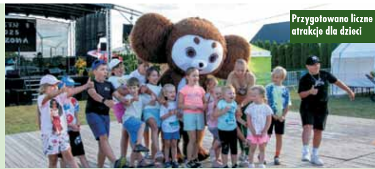
Przygotowano liczne atrakcje dla dzieci

Z programu dofinansowania z KPO dla powiatu kępińskiego, skorzystało kilka instytucji publicznych (szkoły, samorządy) i prywatnych. Z 18 działań dofinansowania w powiecie kępińskim dotacje z KPO przyznano w ramach 5 działań. (patrz tabela obok). m