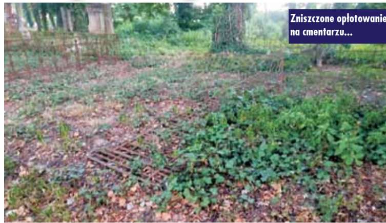
Zniszczone oplotowanie na cmentarzu...

17 sierpnia br., w czasie wieczornej wizyty jednego z członków Stowarzyszenia, stwierdzono poważne zniszczenia: zdewastowane ogrodzenia wokół nagrobków, porzucane śmieci i butelki w rejonie kaplicy. Szczególnie bolesne jest uszkodzenie zabytkowych, sta-