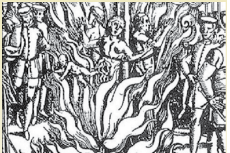
Wyrok na czarownicach na stosie

skutkowało poszukiwaniem sprawców oraz powszechnym dążeniem do eliminacji domniemanych czarownic i czarowników. Pauperyzm przyczynił się do tego, że negatywne i niewyjaśnione zjawiska tłumaczono jako działania zwolenników diabła, a jednocześnie innych obarczano winą, czyniąc z nich kozły ofiarne za własne niepowodzenia.