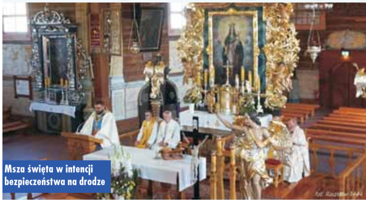
Msza święta w intencji bezpieczeństwa na drodze

życia". O godz. 14.00 odprawiona została msza święta w intencji bezpieczeństwa na drodze oraz za zmarłych motocyklistów i przyjaciół, następnie uczestnicy wyruszyli paradą na motorach w kierunku Trębaczowa, gdzie na terenie tamtejszej parafii odbył się koncert rockowego zespołu KRUK.