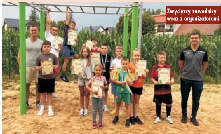
Zwycięzcy zawodnicy wraz z organizatorami

15 lipca br., w ramach wakacyjnych zajęć sportowych, odbyły się zawody Street Workout. Uczestnicy rywalizowali w różnych konkurencjach. Wszyscy uczestnicy otrzymali dyplomy, a najlepsi zawodnicy – pamiątkowe medale.