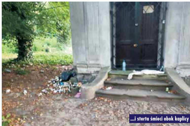
...i sterta śmieci obok kaplicy

Apelujemy do mieszkańców: jeśli ktokolwiek posiada informacje, które mogą przyczynić się do wyjaśnienia tej dewastacji, prosimy o kontakt z Komendą Powiatową Policji w Kępnie lub bezpośrednio ze Stowarzyszeniem Socjum Kępno i okolice. Oprac. m