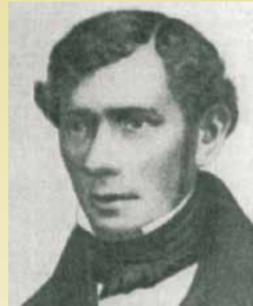
Samuel Holdheim

tej podstawie, że Żydzi nie stanowią narodu politycznego. Żydowskie instytucje religijne muszą być ściśle oddzielone od żydowskich narodowych instytucji, do których te ostatnie należą do prawa małżeństwa i rozwodu. Prawa współczesnych państw nie są sprzeczne z zasadami religii żydowskiej; dlatego te współczesne prawa, a nie żydowskie prawa narodowe innych czasów, powinny regulować żydowskie małżeństwa i rozwody (patrz Samuel Hirsch w „Orient, Lit.” 1843, nr 44). Znaczenie tej książ-