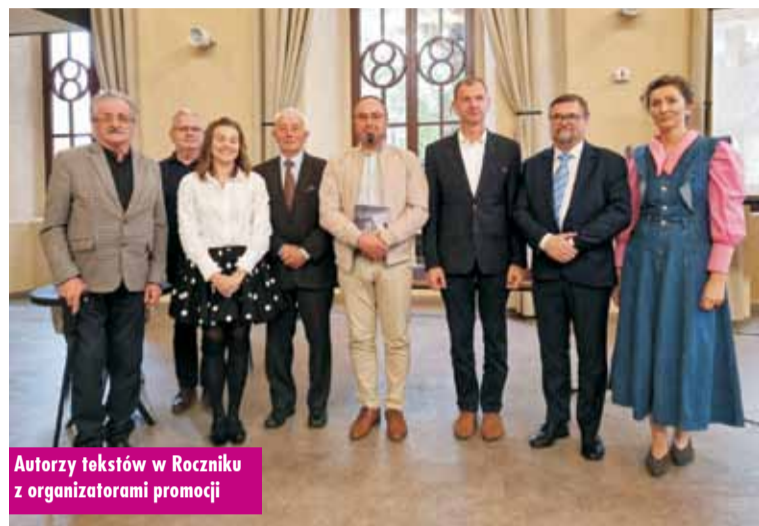
Autorzy tekstów w Roczniku z organizatorami promocji

Rocznik można kupić w cenie 40 zł, w kępińskim muzeum. m