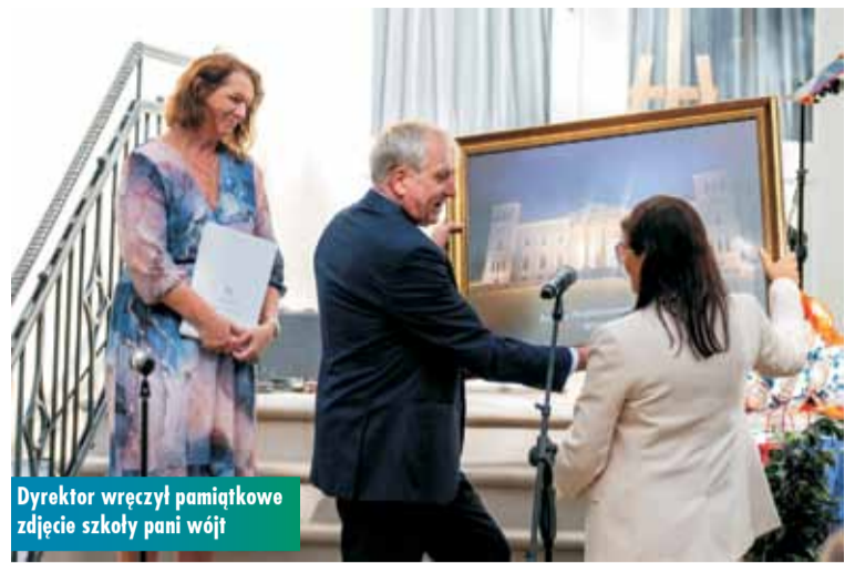
Dyrektor wręczył pamiątkowe zdjęcie szkoły pani wójt

gdzie po remoncie ma zostać zorganizowany Dom Pomocy Społecznej.