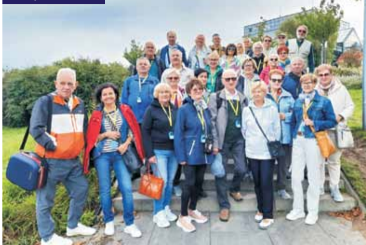
Seniorzy na winobranii

konkatedrę pw. św. Jadwigi Śląskiej. Oglądaliśmy przemarsz słynnego korowodu winobraniowego. Na jarmarku w miasteczku winiarskim degustowaliśmy wina miejscowych