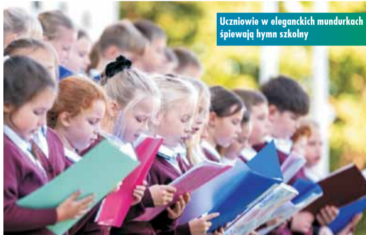
Uczniowie w eleganckich mundurkach śpiewają hymn szkolny

Dyrektor szkoły nie krył zadowolenia z zakończonego remontu, dziękując m.in. za zaangażowanie wójta B. Lewandowskiej-Siwiek , która z kolei podsumowała inwestycję wartą 5 mln. zł, z czego 3,5 mln zł. pochodzi z budżetu państwa – Polskiego Ładu. Modernizacja pałacu