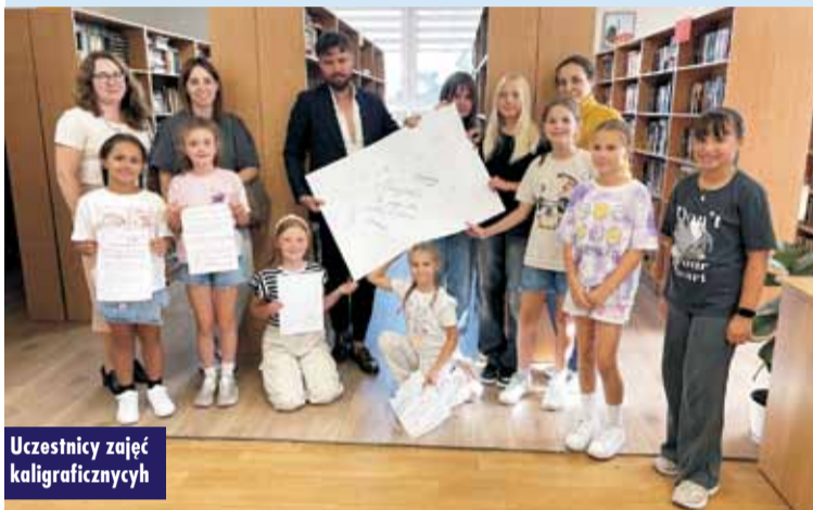
Uczestnicy zajęć kaligraficznych

Gminne Centrum Bibliotecznym w Rychtalu jest miejscem, gdzie tradycja spotyka się z nowoczesnością, a kultura lokalna