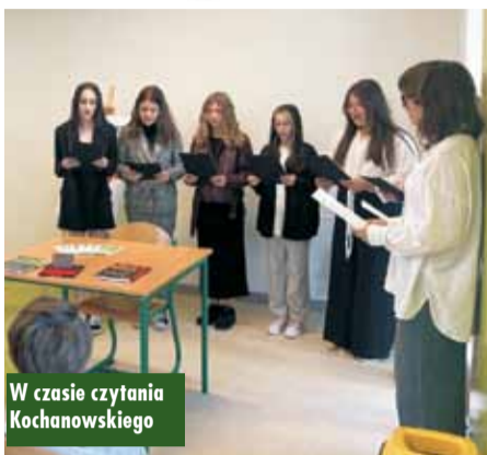
W czasie czytania Kochanowskiego

Na koniec wszyscy uczestnicy otrzymali specjalnie przygotowane