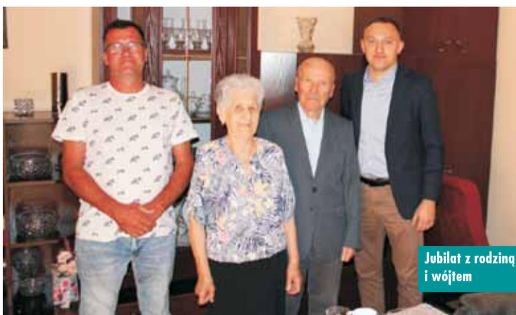
Jubilat z rodziną i wójtem