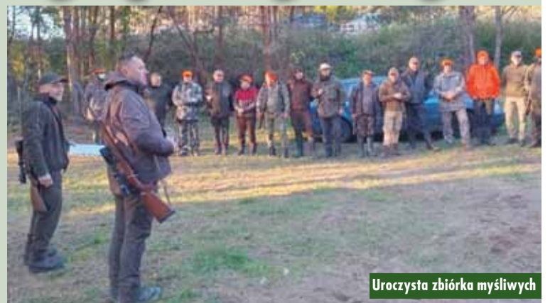
Uroczysta zbiórka myśliwych