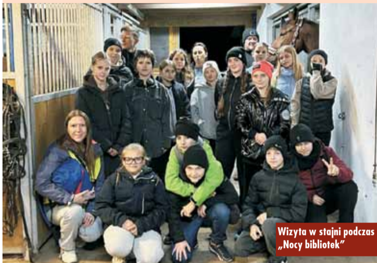
Wizyta w stajni podczas „Nocy bibliotek”