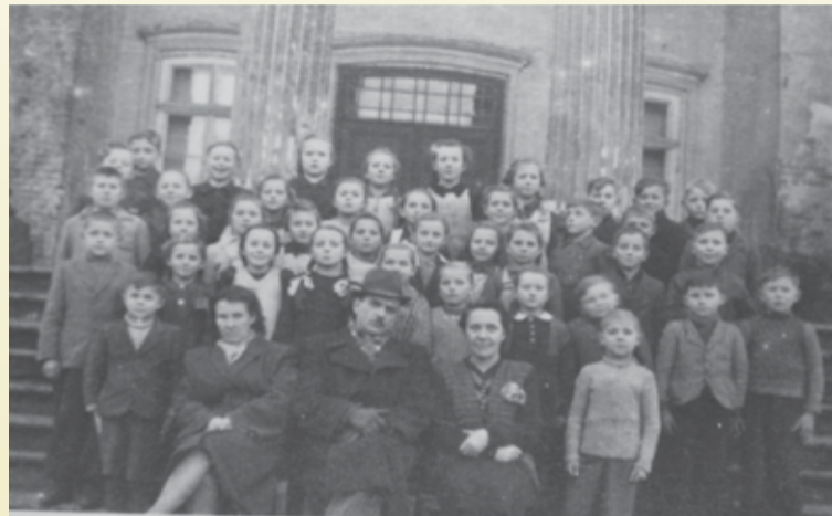
Grono nauczycielskie z częścią dzieci szkolnych, 1948 r.