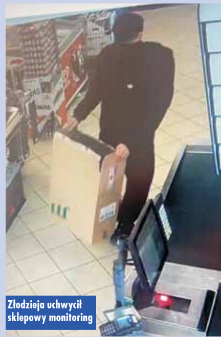
Złodzieja uchwycił sklepowy monitoring

konania kradzieży wyrobów tytoniowych w postaci paczek papierosów o łącznej wartości ponad 2 tysięcy złotych, tj. o czyn z art. 278 § 1 kk, za co grozi kara nawet do 5 lat pozbawienia wolności. Oprac. KR