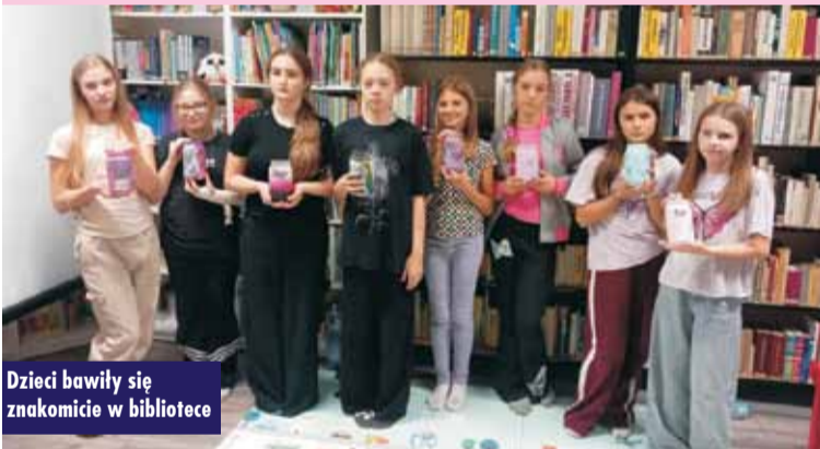
Dzieci bawiły się znakomicie w bibliotece