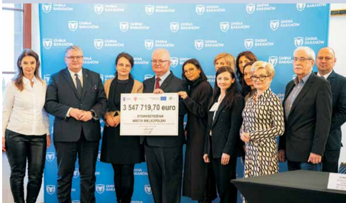
Funkcjonujące na obszarze powiatu kępińskiego Stowarzyszenie Wrota Wielkopolski otrzymało 3,5 mln euro do rozdystrybuowania wśród beneficjentów w ramach ogłaszanych sukcesywnie naborów wniosków. Środki na ten cel pochodzą z trzech funduszy: rolnego, społecznego oraz rozwoju regionalnego.

Cały proces aplikowania o pomoc finansową do lokalnych grup działania, rozpatrywania wniosków przez LGD oraz Samorząd Województwa Wielkopolskiego, zawierania umów oraz rozliczenia zrealizowanych przedsięwzięć odbywa się w formie elektronicznej przy użyciu Platformy Usług Elektronicznych ARiMR oraz Centralnego Systemu Obsługi Beneficjentów.