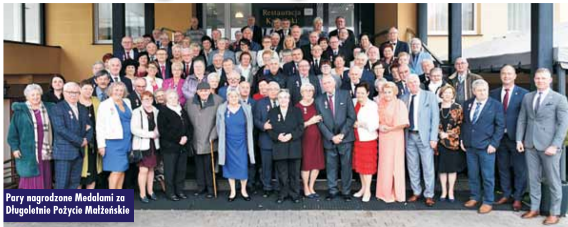
Pary nagrodzone Medalami za Długoletnie Pożycie Małżeńskie

28 października br. parom z gminy Kępno, które w 2024 r. obchodziły jubileusz Złotych Godów, uroczystie wręczone zostały Medale za Długoletnie Pożycie Małżeńskie, przyznane przez Prezydenta RP. Medale parom przekazywane są jako dowód uznania za zgodność pożycia małżeńskiego, za trud pracy i wielu wyrzeczeń dla dobra założonej przed pół wiekiem rodziny. 50 wspólnie