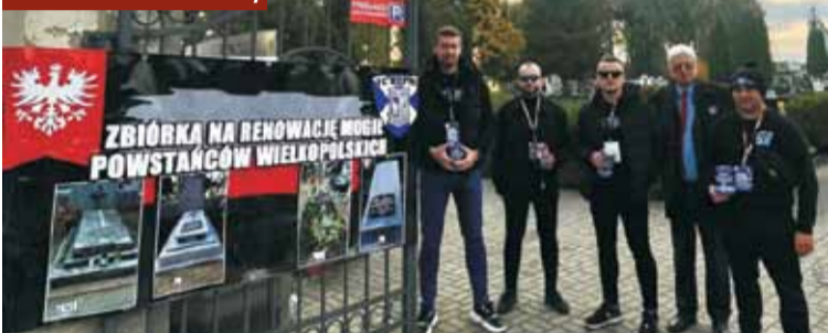
Kibice Lecha w czasie kwesty

część wspólnej akcji Stowarzyszenia Kibiców Wiary Lecha. Środki te zbierane są na renowację grobów powstańców wielkopolskich. Dzięki takim zbiórkom udało się już odnowić setki miejsc ich spoczynku.