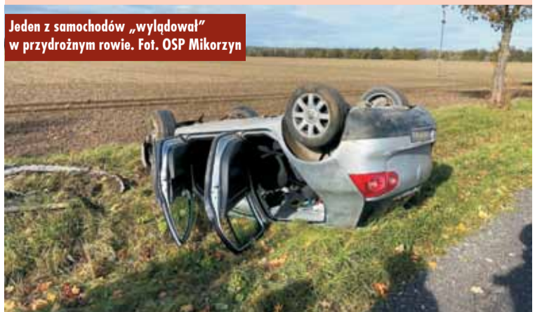
Jeden z samochodów „wylądował” w przydrożnym rowie.