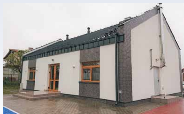
Dzięki wsparciu z PROW 2014-2020 w ramach inicjatywy LEADER Gmina Bralin zrealizowała inwestycję polegającą na budowie Domu Ludowego w Nosalach.

Lokalne grupy działania opracowując strategie rozwoju były zobowiązane do zdefiniowania obszarów gospodarki, które mają kluczowe znaczenie dla rozwoju danego obszaru. W strategiach pojawiają się takie branże jak przetwórstwo lokalne, edukacja, usługi turystycz-