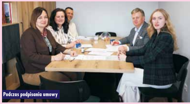
Podczas podpisania umowy

Wartość umowy to 7 920 000 zł. Celem zadania jest poprawa warunków pracy, zwiększenie dostępności urzędu oraz poprawa jakości usług dla mieszkańców i interesantów. Oprac. m