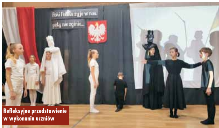
Refleksyjne przedstawienie w wykonaniu uczniów