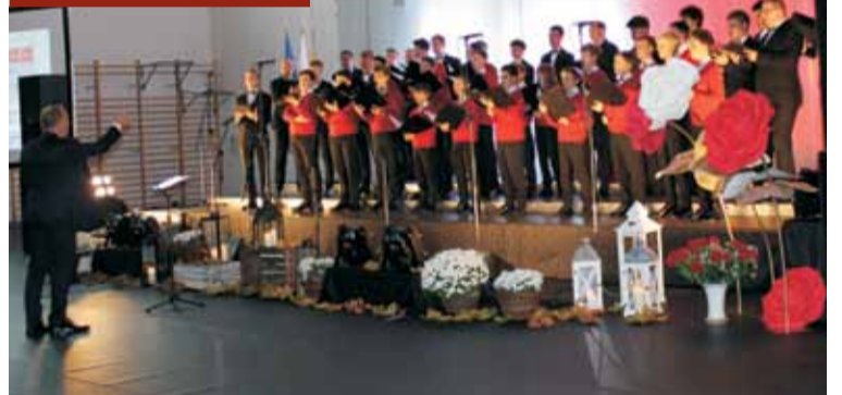
Koncert w wykonaniu Poznańskiego Chóru Chłopięcego