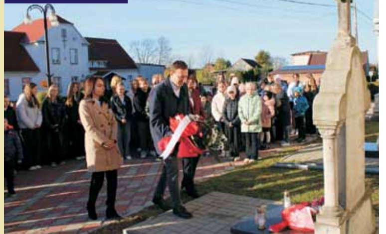
Władze gminy złożyły wiązanki kwiatów na grobach