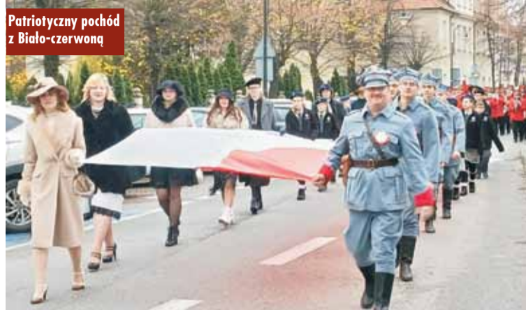
Patriotyczny pochód z Biało-czerwoną

samorządowe, szkoły, organizacje społeczne, służby mundurowe, w asyście orkiestry, przemaszerowały na kępiński Rynek, pod Pomnik