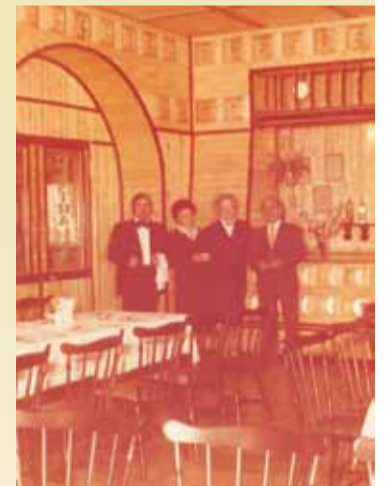
Kierownictwo i kelnerzy „Centralnej”

W tamtym czasie przy kieliszku ukłuły się potoczne nazwy regionów i zamieszkałych tam tubylców. Przypomnę te nazwy, co dziś byłoby niepoprawnością obyczajową, tak jak sklep „Murzynek” na kępińskim Ryнку pod nr 9 (lata 70., 80.), z wyjątkowym narożnym neonem. I tak jadąc przez Polskę z północy na południe, mamy nazwy własne poszczególnych regionów: pomorskie (Gdańsk, Kaszuby) – śledzie, gorzowskie – Rumuni, zielonogórskie – falubazy, bydgosko-toruńskie – Pałuki, poznańskie – pyrusy, mazowieckie – krawaciarze, łódzkie – tramwajarze, Mazury – Krzyżacy, świętokrzyskie – scyzoryki, małopolskie – lajkoniki, konińskie – brykiety, kaliskie – ce-