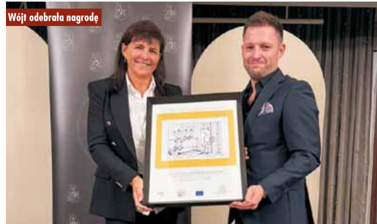
Wójt odebrała nagrodę

kazują się zaangażowaniem w rozwój swojego regionu, wprowadzając innowacyjne rozwiązania, które mają długofalowy, pozytywny wpływ na lokalną społeczność. ugb