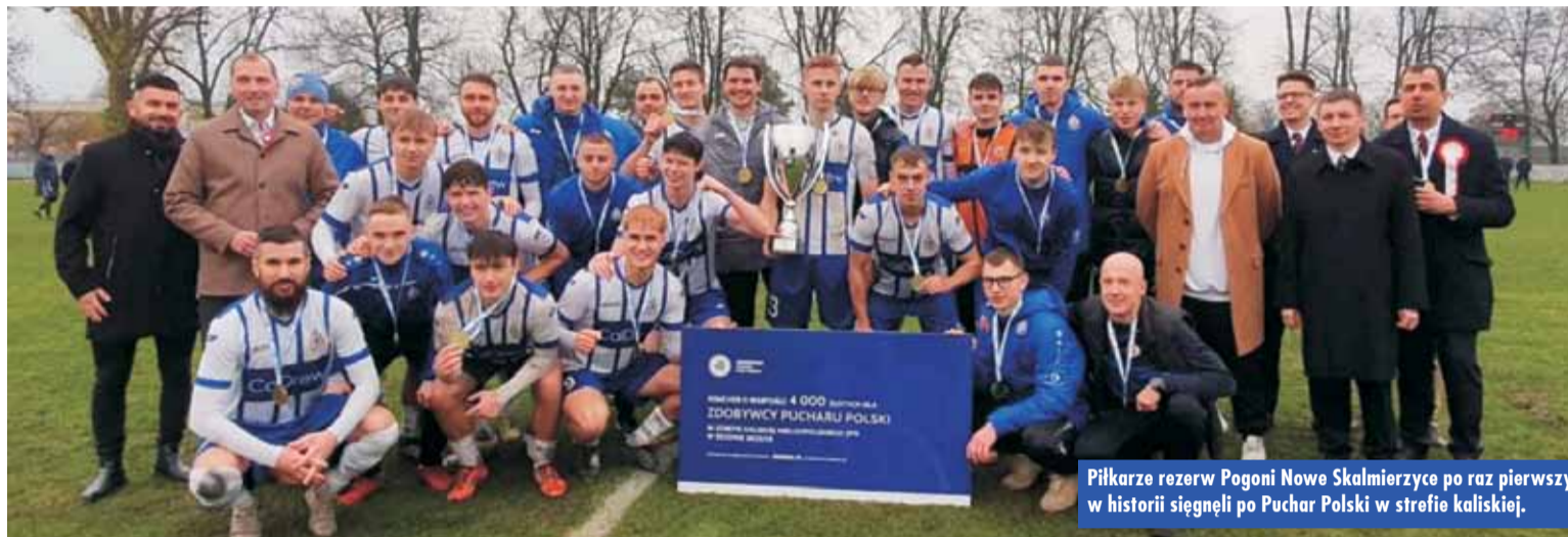
Piłkarze rezerw Pogoni Nowe Skalmierzyce po raz pierwszy w historii sięgnęli po Puchar Polski w strefie kaliskiej.

Losowanie pierwszego etapu rozgrywek o Puchar Polski w naszym województwie odbędzie się w drugiej połowie listopada. Wiadomo, że kolejne rundy pucharowych zmagania odbędą się 25 marca (1/8 finału), 15 kwietnia (ćwierćfinały) i 20 maja (półfinały). Wielki finał, którego stawką będzie przepustka do rozgrywek szczebla centralnego, zaplanowano z kolei na 27 maja. BAS