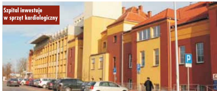
Szpital inwestuje w sprzęt kardiologiczny

w Kępnie przejdą specjalne szkolenia. Będą oni pomagać pacjentom przez cały proces leczenia: umawiać na badania i konsultacje, pilnować kolejnych etapów leczenia, tłumaczyć