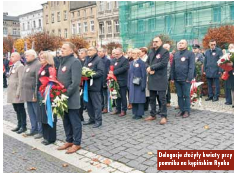
Delegacje złożyły kwiaty przy pomniku na kępińskim Ryнку