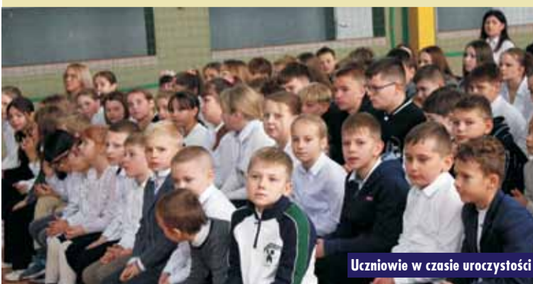
Uczniowie w czasie uroczystości

31 października br. w Zespole Szkół im. Ks. Michała Przywary i Rodziny Salomonów w Nowej Wsi Książęcej odbyły się uroczyste ob-