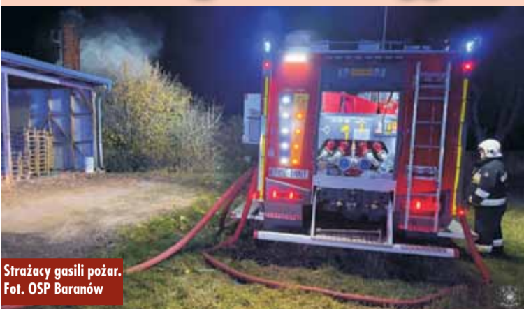
Strażacy gasili pożar.

8 listopada br., około godziny 4.30, do Stanowiska Kierowania Komendanta Powiatowej Straży Pożarnej w Kępnie wpłynęło zgłoszenie o pożarze na terenie jednego z zakładów produkcyjnych w Grębaninie. Na miejsce zdarzenia zadysponowano zastępy z Jednostki Ratowniczo-Gaśniczej w Kępnie, OSP Grębanin, OSP Mroczeń, OSP Baranów i OSP Opatów.