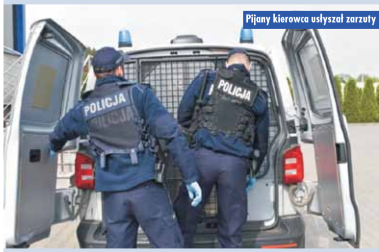
Pijany kierowca usłyszał zarzuty