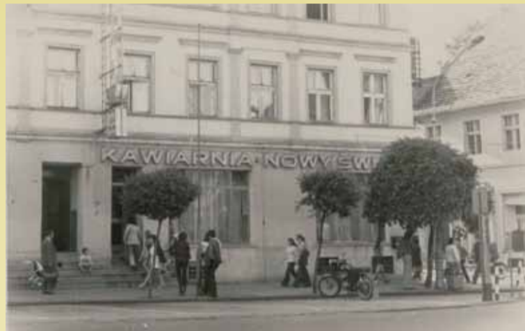
„Nowy Świat”, lata 70. XX w.

Pod „Nowym Światem” Ściganego organizował dla wybranych wyścigi ślimaków, gdzie podchmieleni bywalcy obstawiali ślimakowego zwycięzcę. W kawiarni brak miejsc, przy stolikach siedzą po kilku, a „dymna siekiera” nad nimi. Popijają Winiak Klubowy, Piwo Grodzkie, a spod stolika leje się do literatek kartkowa wódka i ta bezkarkowa, zakupiona na melinie „u Maryli”. Kelnerki uwijają się wśród rozbawionych gości jak w