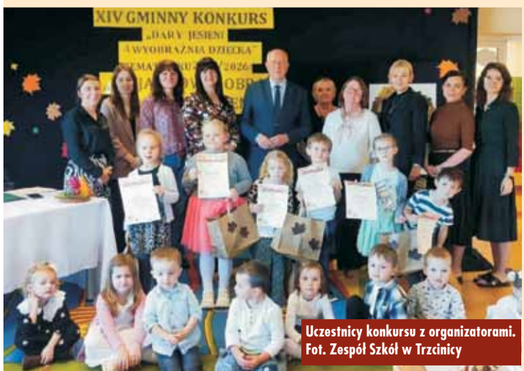
Uczestnicy konkursu z organizatorami.

Konkurs zorganizowały: Aneta Jędryca i Patrycja Balcerzak – nauczycielki wychowania przedszkolnego w Publicznym Przedszkolu Samorządowym w Trzciniccy. Oprac. m