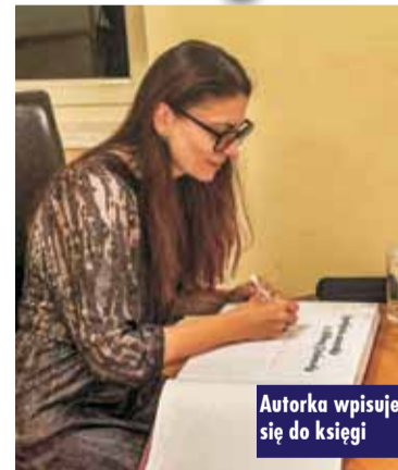
Autorka wpisuje się do książki

Winnych”, która została zekranizowana jako serial telewizyjny, gromadzący przed ekranami miliony widzów. Tworząc sagę, zadbała o autentyczność historyczną, wplatając w fabułę postacie znanych osobistości, takich jak Jarosław Iwaszkiewicz czy Stanisław Lilpop . Podczas pracy nad ekranizacją pełniła również funkcję konsultanta medyczno-historycznego, a sama pojawiała się w epizodycznych rolach w każdym sezonie serialu.