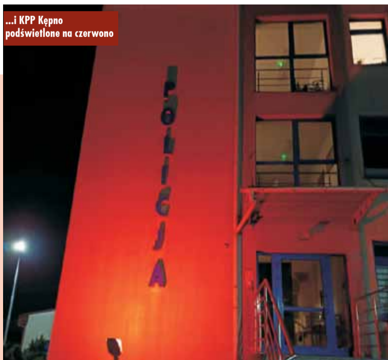
...i KPP Kępno podświetlone na czerwono