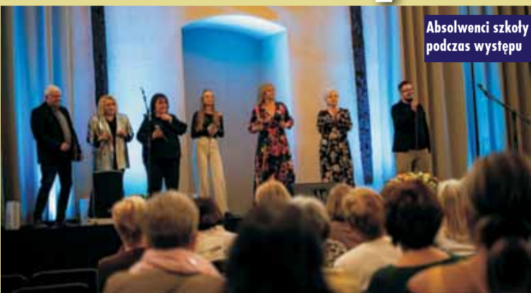
Absolwenci szkoły podczas występu

Jeszcze słuchamy, co nam w duszy gra... i myślimy, czy na pewno czas tornistrów dawno minął?