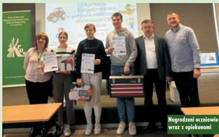
Nagrodzeni uczniowie wraz z opiekunami

narzędziową, drugie miejsce zostało nagrodzone zestawem narzędziowym, a zdobywczyni trzeciego miejsca otrzymała wiertarkę udarową.