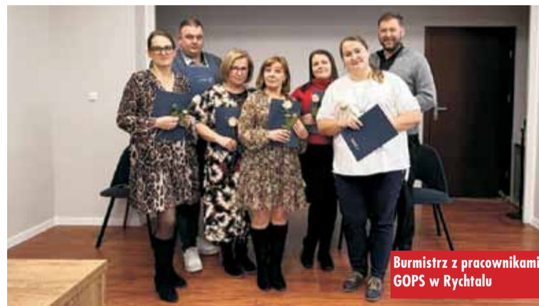
Burmistrz z pracownikami GOPS w Rychtałach

Kępińscy policjanci przeprowadzili na terenie powiatu kępińskiego działania pn. „Trzeźwość”. Przebadano 360 kierujących, a dwóch z nich straciło uprawnienia za jazdę pod wpływem alkoholu