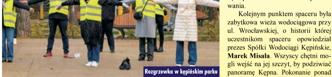
Rozgrzewka w kępińskim parku

Nawet krótki spacer może sprawić, że czujemy się lepiej. To prosta aktywność, szczególnie polecana osobom, które prowadzą siedzący tryb życia i mają nie najlepszą kondycję. Spacerując, poprawiamy kondycję i nastrój. To prosta recepta, którą znamy zapewne wszyscy.