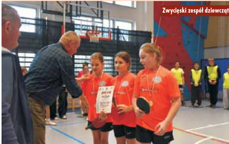
Zwycięski zespół dziewcząt

20 i 21 listopada br. w gminie Łęka Opatowska odbyły się Mistrzostwa Powiatu w Drużynowym Tenisie Stołowym Szkół Podstawowych. Rozgrywki podzielono na dwa etapy: klasy IV-VI rywalizowały w Siemianicach w ramach „XXVII Igrzysk Dzieci 2025/2026”, natomiast klasy VII-VIII zmierzyły się dzień później w Łęce Opatowskiej podczas „XXVII Igrzysk Młodzieży Szkolnej 2025/2026”.