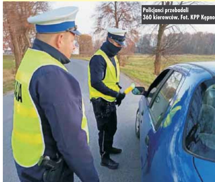
Policjanci przebadali 360 kierowców.