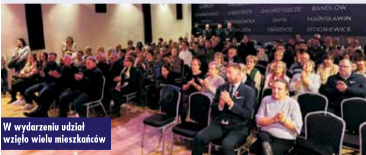
W wydarzeniu udział wzięło wielu mieszkańców

zek”, przypominające, że wolność wymaga troski, jedności i odpowiedzialności każdego z nas. Pomimo niesprzyjającej pogody, frekwencja dopisała, a atmosfera wydarzenia