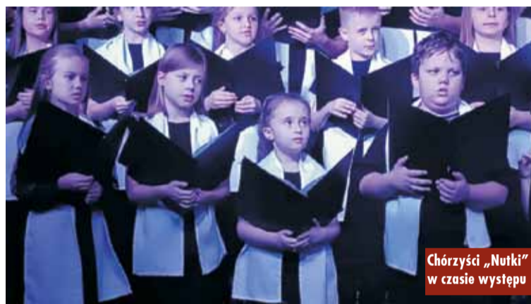
Chórzyści „Nutki” w czasie występu