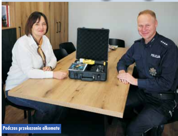
Podczas przekazania alkomatu

Dzielnicy Posterunku Policji w Bralinie został wyposażony w samoobsługujący alkomat. Jego zakup sfinansował Urząd Gminy w Perzowie. Urządzenie będzie dostępne dla wszystkich mieszkańców i przyczyni się do poprawy bezpieczeństwa gminy Perzów.