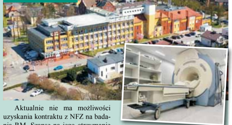
Rezonans magnetyczny od drugiego kwartału w szpitalu

Aktualnie nie ma możliwości uzyskania kontraktu z NFZ na badania RM. Szanse na jego otrzymanie mogą pojawić się dopiero po uruchomieniu pracowni oraz wykazaniu potrzeb i wykonania. - Gdybyśmy czekali na kontrakt, diagnostyka nie poprawiłaby się przez kolejne lata i dalej musielibyśmy transportować pacjentów do innych miast. Komer- cyjny operator pozwala uruchomić usługę natychmiast, a jeśli w przyszłości pojawi się możliwość zakon- traktowania badań, to szpital będzie do tego formalnie przygotowany – wyjaśnia dyrektor.