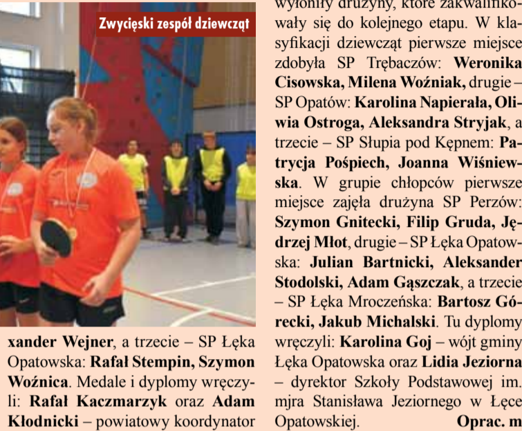
Rywalizacja była zacięta