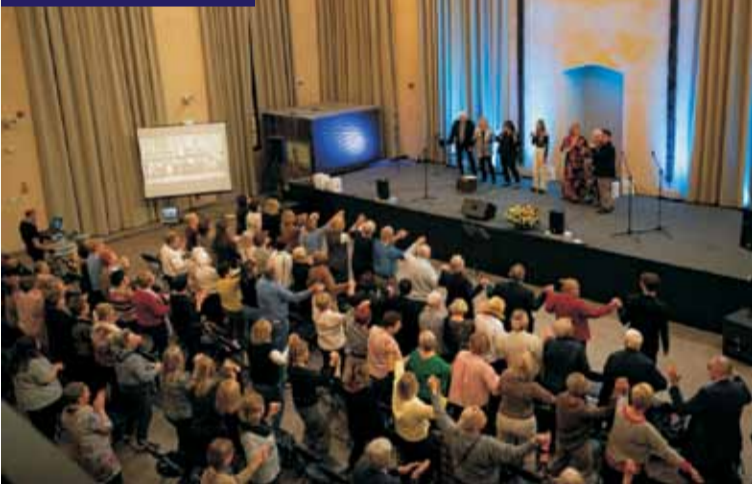
Koncert zgromadził wiele osób

Stowarzyszenie Absolwentów i Wychowanków Gimnazjum i Liceum Ogólnokształcącego im. mjr. H. Sucharskiego w Kępnie