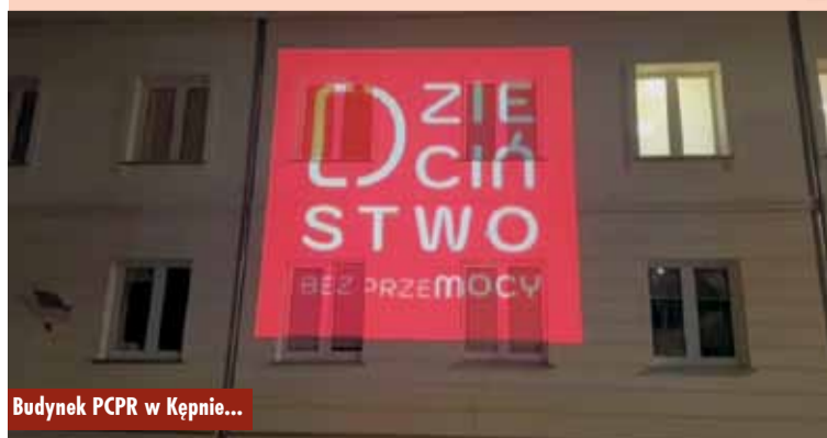
Budynek PCPR w Kępnie...

19 listopada przypada Międzynarodowy Dzień Zapobiegania Przemocy Wobec Dzieci. To ważna okazja do dyskusji o działaniach służących skutecznemu i kompleksowemu przeciwdziałaniu przemocy domowej, której ofiarami padają właśnie osoby małoletnie. Tego dnia fasady wielu budynków użyteczności publicznej, również w powiecie kępińskim, rozświetliły się na czerwono, aby wyrazić sprzeciw wobec krzywdzenia dzieci. Nie bądźmy obojętni! Oprac. KR