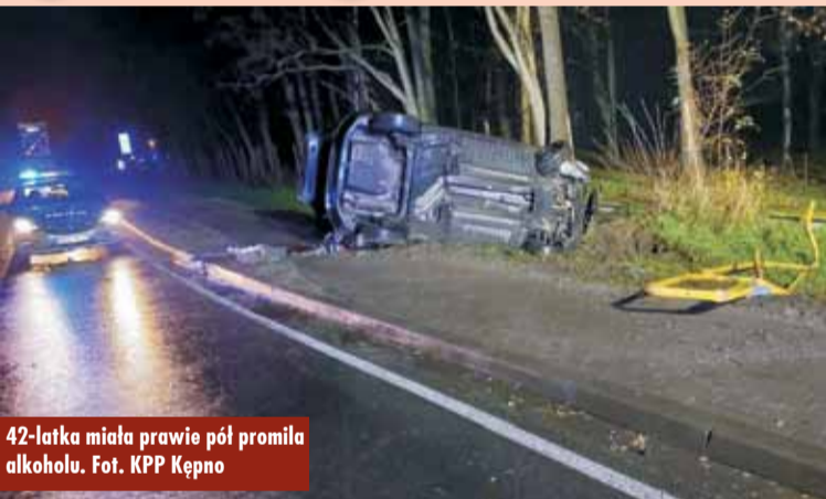
42-latkę miała prawie pół promila alkoholu.

16 listopada br., po godzinie 3.00, dyżurny Komendy Powiatowej Policji w Kępnie otrzymał zgłoszenie o zdarzeniu drogowym w Słupi pod Kępnem. Po przybyciu na miejsce policjanci Ognia Patrolowo-Interwencyjnego ustalili, że kierująca samochodem osobowym marki Peugeot, 42-letnia mieszkanka gminy Kępno,