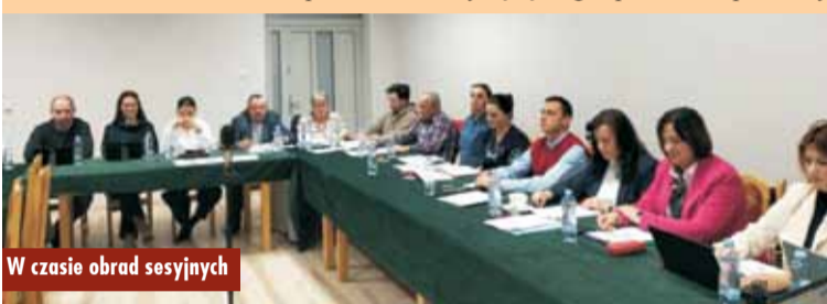
W czasie obrad sesyjnych

nika 2025 r. Dokument ten określa w perspektywie rocznej cele, zasady, przedmiot i formy współpracy, a także obszary oraz priorytetowe zadania publiczne realizowane w ramach współpracy Gminy z organizacjami pozarządowymi prowadzącymi działalność pożytku publicznego na terenie gminy lub na rzecz jej mieszkańców. Na realizację zadań publicznych objętych niniejszym programem planuje się ogółem kwotę 200 000 zł. Środki te zostaną przeznaczone na realizację zadań publicznych w ramach otwartego konkursu ofert.