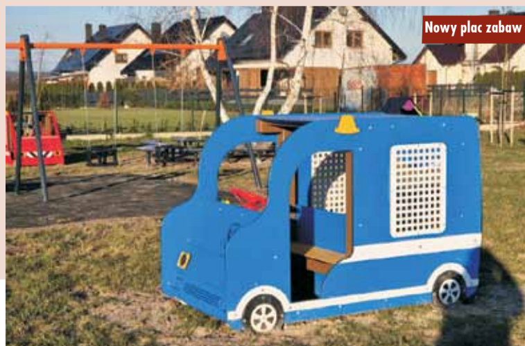
Nowy plac zabaw