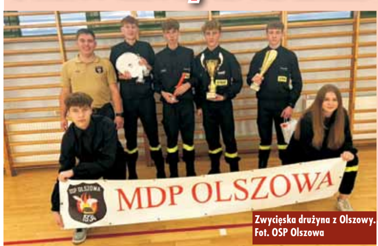
Zwycięska drużyna z Olszowy.