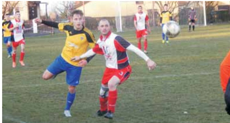
Wielkopolanin Siemianice, lider Kaliskiej Klasy B walczył ambitnie, ale nie wystarczyło to na pokonanie drugiej siły Wielkopolskiej piłki. Pucharowa przygoda drużyny z Siemianic była niczym bajka. Szkoda, że zabrakło w niej tylko pięknego zakończenia...