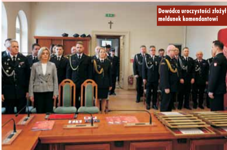
Dowódca uroczystości złożył meldunek komendantowi

nych jednostek z obszaru powiatu – za codzienną, pełną poświęcenia i zaangażowania służbę. Jednym z najważniejszych elementów uroczystości było wręczenie wyróżnień, odznaczeń oraz nominacji na wyższe stopnie służbowe, nadanych przez ministra spraw wewnętrznych i administracji, wielko-