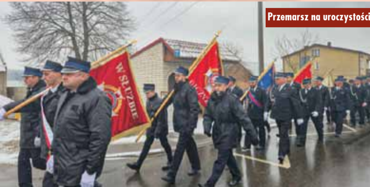
Przemarsz na uroczystości

23 listopada br. strażacy, mieszkańcy Biadaszek oraz zaproszeni goście zgromadzili się, by uroczystie uczcić wyjątkowy jubileusz – 90-lecie działalności Ochotniczej Straży Pożarnej w Biadaszkach. Było to wydarzenie pełne wzruszeń, wspomnień i dumy z bogatej historii jednostki, która od dziewięciu dekad stoi na straży bezpieczeństwa lokalnej społeczności.