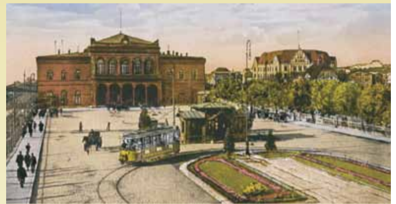
Dworzec Główny w Poznaniu, lata 1898-1945.

Przed pierwszą wojną światową linia ta miała dwie części. Część