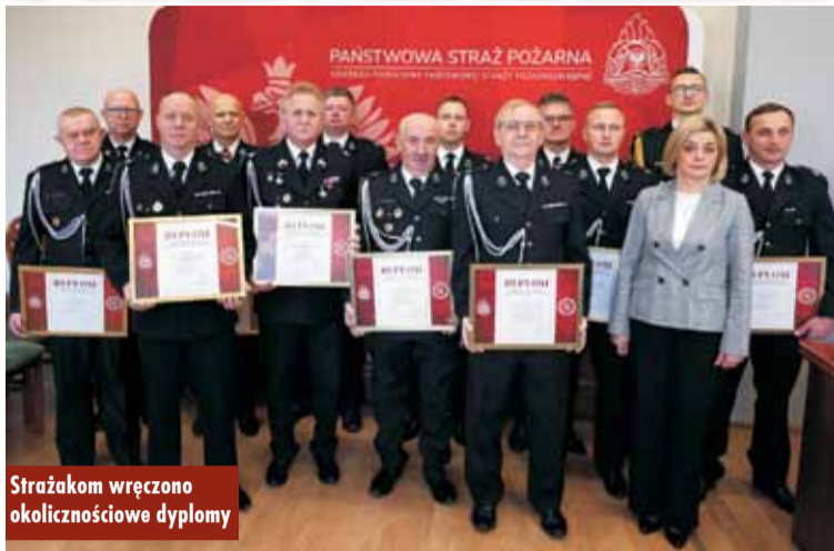
Strażakom wręczono okolicznościowe dyplomy

28 listopada br. w sali sesyjnej Starostwa Powiatowego w Kępnie odbyła się uroczysta zbiórka z okazji Narodowego Święta Niepodległości z udziałem funkcjonariuszy Komendy Powiatowej Państwowej Straży Pożarnej w Kępnie oraz druhów Ochotniczych Straży Pożarnych z terenu powiatu kępińskiego.