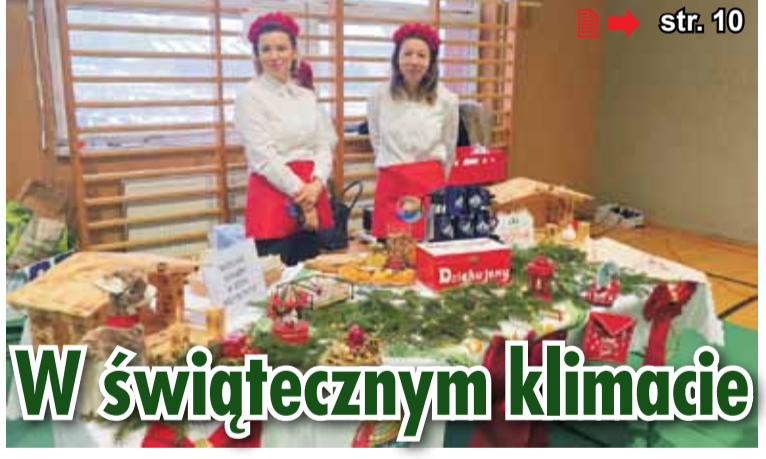
➔ str. 10