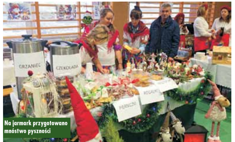
Na jarmark przygotowano mnóstwo pyszności

Na ostatniej sesji Rady Gminy w Łęce Opatowskiej radni ustalili wysokość ekwiwalentu pieniężnego dla strażaków-ochotników