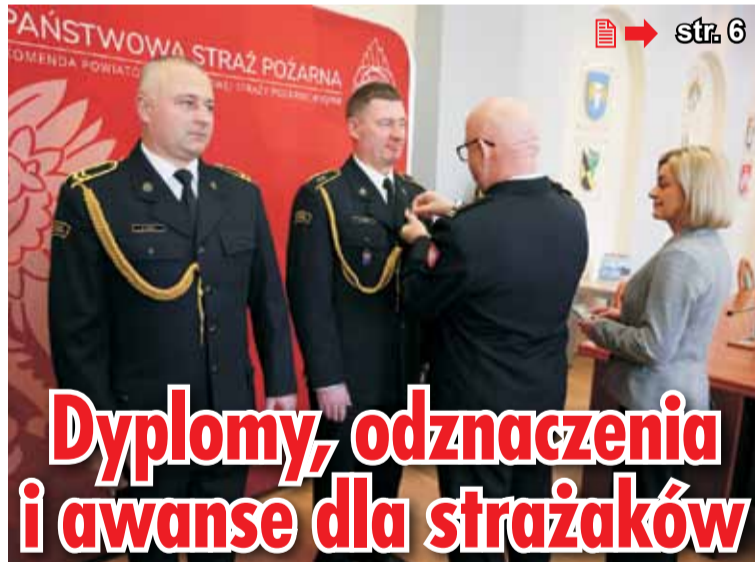
➔ str. 6

150 lat linii kolejowej Kluczbork – Poznań ➔ str. 4