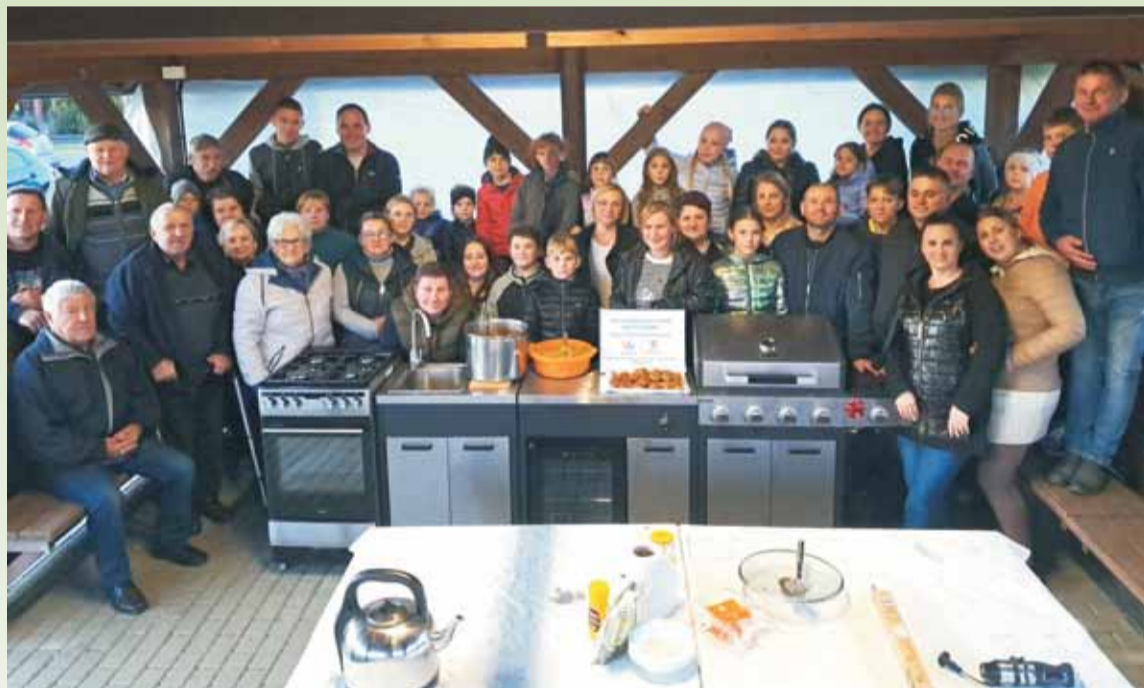
Stowarzyszenie Odnowa i Rozwój Izabelina (gm. Brudzew) warsztaty z niemarnowania żywności z użyciem małej mobilnej kuchni warsztatowej przeprowadziło w plenerze. Kuchnia została zakupiona z dofinansowania Samorządu Województwa Wielkopolskiego.

Zachętą dla samorządów do walki z marnowaniem żywności jest możliwość skorzystania z dotacji w ramach konkursu „Wielkopolskie Jadalnielnie”. Maksymalna wnioskowana kwota dotacji w ramach jednej oferty wynosi 25 tys. zł, nie więcej jednak niż 80% całkowitego kosztu zadania. Po otrzymaniu wsparcia z budżetu Województwa