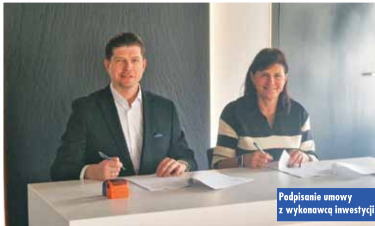
Podpisanie umowy z wykonawcą inwestycji

sołectwo, ma własną straż pożarną i kościół. W centrum jest rynek, czyli... ul. Nowy Rynek. Obecnie to pusty plac, leżący pośród zabudowy mieszkaniowej jedno- i wielorodzinnej. Planowana inwestycja skomunikuje ulice: Ks. Antoniego Świadka,