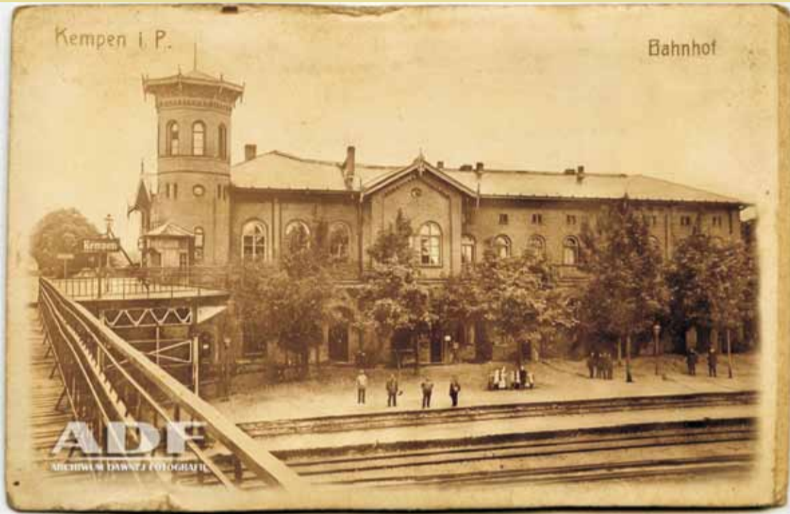
Kępno, dworzec kolejowy, 1902 r.

Ważnym elementem związanym z linią 272 w Kępnie był istniejący do dnia dzisiejszego unikatowy, dwupoziomowy dworzec kolejowy [5] . Linie kolejowe krzyżują się na nim na dwóch peronach (peron górny i dolny), pod kątem 90 stopni, co było rozwiązaniem niespotykanym na skale europejską. Dworzec zaplanowano w kształcie litery L. W miejscu połączenia skrzydeł budynku zlokalizowano sześciokątny hol z kasami biletowymi oraz poczekalnią dla podróżnych, a także restaurację dla pasażerów oraz osób oczekujących na podróż-