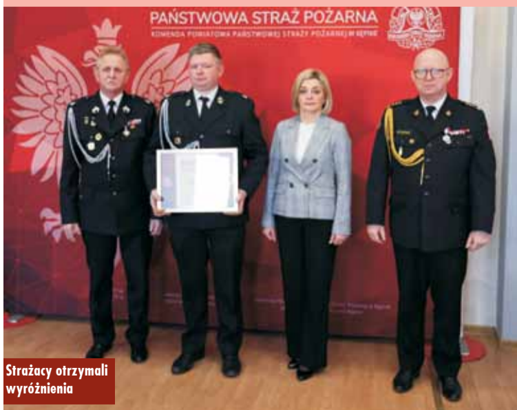
Strażacy otrzymali wyróżnienia