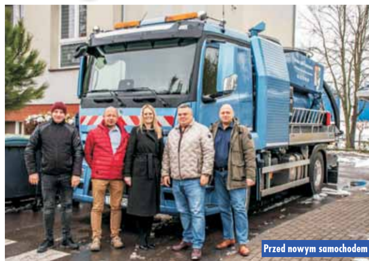
Przed nowym samochodem

Gmina Łęka Opatowska zakupiła specjalistyczny samochód ssąco-płuczący do czyszczenia kanalizacji. Pojazd ze specjalistyczną zabudową będzie służyć do utrzymania i czyszczenia kanalizacji sanitarnej, deszczowej oraz przepompowni ścieków. Samochód wyposażony jest m.in. w zbiornik o pojemności 8 000 l z podziałem na komory na wodę czystą i brudną. Pojazd posiada również pompę ssącą o wydajności 1500 m 3 /h, pompę ciśnieniową o wydajności 330 l/min wraz z wysięgnikiem, niezbędnymi węzami oraz pełnym wyposażeniem. Samochód dostarczyła firma Pojazdy Komunalne Tymborowscy Sp. z o.o. za kwotę 2 460 000 zł (brutto).