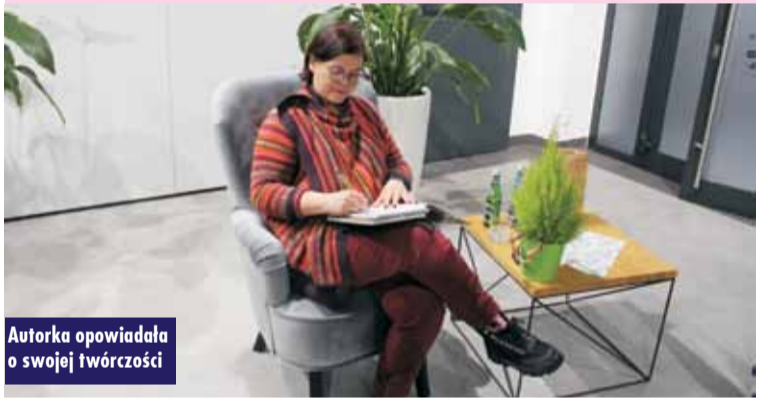
Autorka opowiadała o swojej twórczości