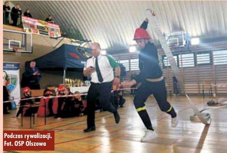
Podczas rywalizacji.