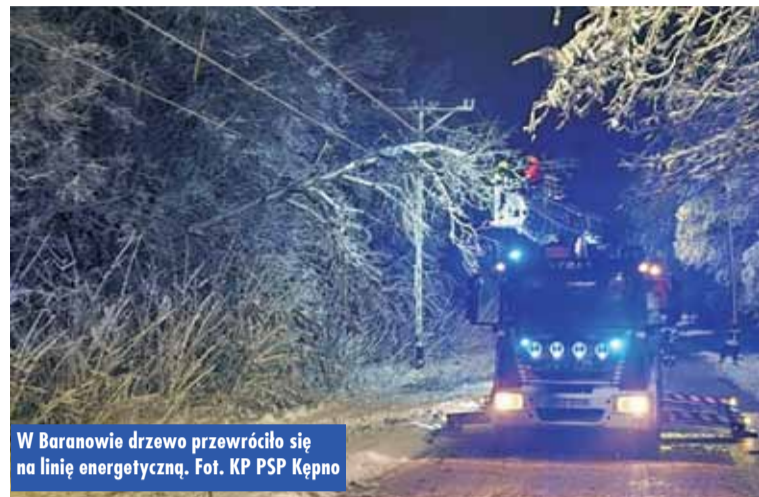
W Baranowie drzewo przewróciło się na linię energetyczną.

W środę, 26 listopada br., dyżurny Stanowiska Kierowania Komendanta Powiatowego Państwowej Straży Pożarnej w Kępnie otrzymał 15 zgłoszeń o zdarzeniach wymagających interwencji jednostek ochrony przeciwpożarowej, w tym jedno zgłoszenie fałszywe. Wszystkie odnotowane zdarzenia dotyczyły powalonych lub złamanych drzew w związku z intensywnymi opadami śniegu. - Działania strażaków w