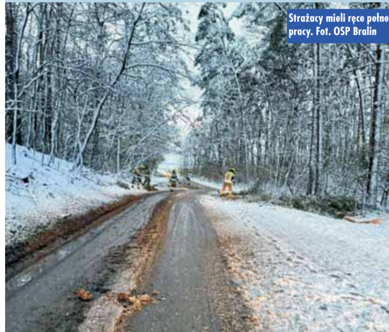
Strażacy mieli ręce pełne pracy.

każdym wypadku polegały na zabezpieczeniu miejsca zdarzenia oraz usunięciu uszkodzonych drzew ze szlaków komunikacyjnych przy wykorzystaniu pilarek do drewna. Jedno ze zdarzeń, które miało miejsce w Baranowie, wymagało współpracy z Pogotowiem Energetycznym z uwagi na prowadzenie działań w obrębie linii energetycznej – mówi oficer prasowy KP PSP Kępno, kpt. Jakub Sobczak . Oprac. KR