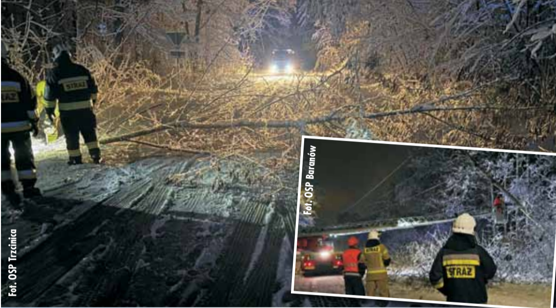
Fot. OSP Trzcinica