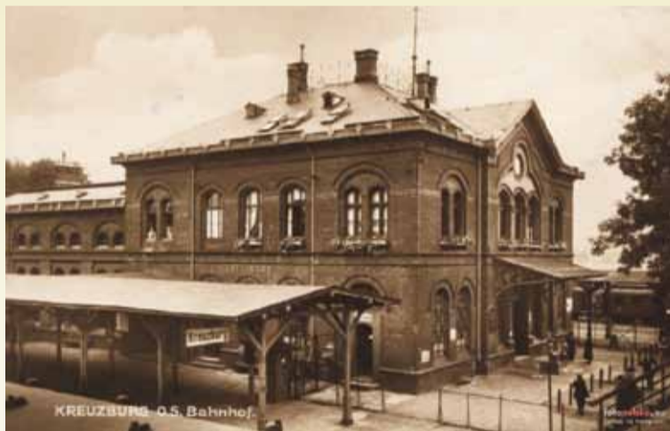
Dworzec kolejowy w Kluczorku z lat 1935-1938.

który to, jeszcze tego samego roku, otrzymał od pruskiego ministra handlu pozwolenie na rozpoczęcie prac przygotowawczych. 7 października 1872 r. cesarz niemiecki, a zarazem król pruski, Wilhelm I, podpisał koncesję na budowę linii kolejowej. W tym celu utworzono spółkę „Towarzystwo Poznańsko-Kluczborskiej Kolei Żelaznej” (Posen-Kreuzburger Eisenbahn, PKE).