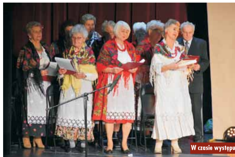
W czasie występu