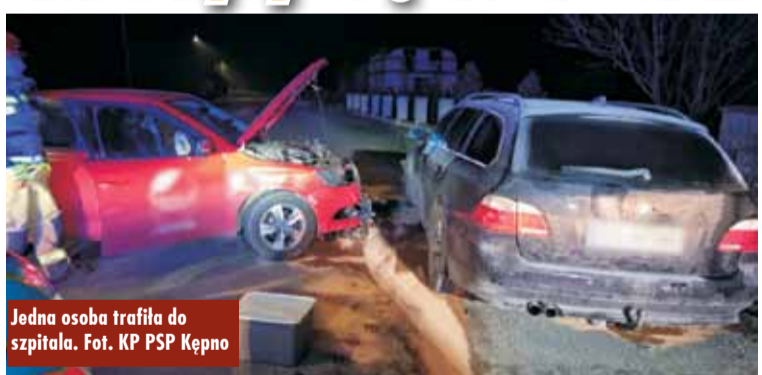
Jedna osoba trafiła do szpitala.

21 listopada br., około godziny 22.30, do Stanowiska Kierowania Komendanta Powiatowego Państwowej Straży Pożarnej w Kępnie wpłynęło zgłoszenie o wypadku drogowym w Perzowie. Na miejsce natychmiast zadysponowano zastępy z Jednostki Ratowniczo-Gaśniczej w Kępnie oraz Ochotniczej Straży Pożarnej w Perzowie. Po przybyciu służb stwierdzono zderzenie dwóch samochodów osobowych, którymi podróżowały trzy osoby. Jedna z nich uskarżała się na ból w klatce piersiowej i wymagała pomocy medycznej. - Strażacy udzielili poszkodowanej osobie kwalifikowanej pierwszej po-