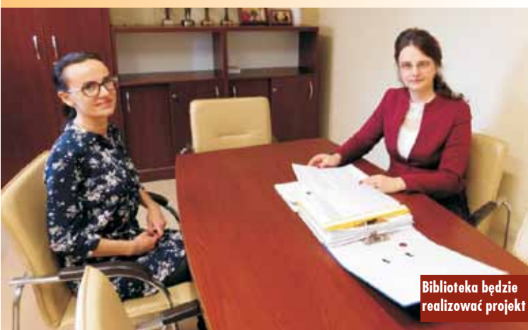
Biblioteka będzie realizować projekt