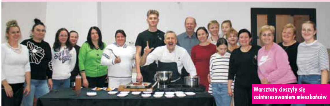
Warsztaty cieszyły się zainteresowaniem mieszkańców