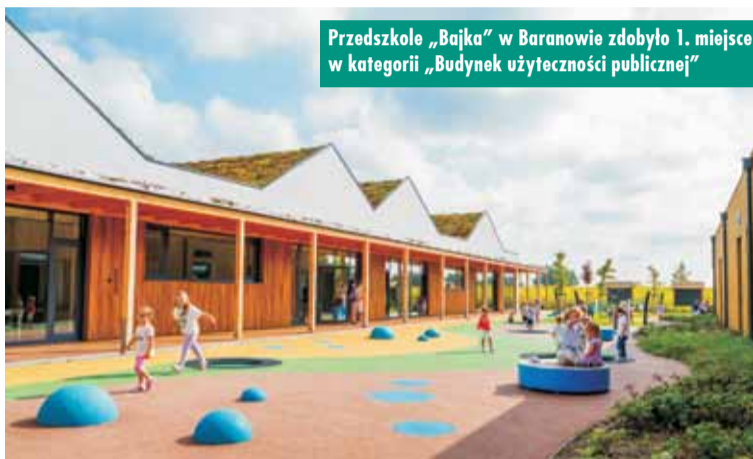
Przedszkole „Bajka” w Baranowie zdobyło 1. miejsce w kategorii „Budynek użyteczności publicznej”