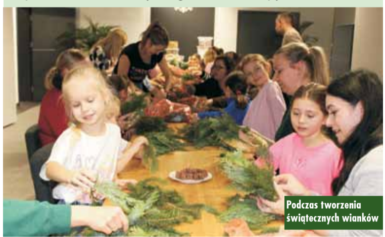
Podczas tworzenia świątecznych wianków

stworzyć dekorację w swoim stylu. Mnóstwo naturalnych dodatków, kolorowe wstążki, szyszki i zimowe akcenty sprawiły, że powstawały niepowtarzalne ozdoby. Warsztaty stały się okazją do rodzinnej współpracy i kreatywnego spędzenia czasu w świątecznej atmosferze. Powstałe wianki zachwycały pomysłowością, oryginalnością i starannością wykonania, które z pewnością podkreślą w domach klimat nadchodzących świąt. E. Lesiak