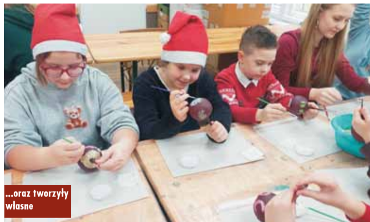
...oraz tworzyły własne

6 grudnia br. Gmina Bralin zorganizowała mikołajkowy wyjazd dla dzieci z terenu gminy do Fabryki Bombek w Krośnicach. Wyieczka była doskonałą okazją, by najmłodszy poczuli magię nadchodzących świąt i zobaczyli, jak powstają ręcznie malowane bombki, które zdobiją choinki w całej Polsce. Podczas wizyty dzieci zwiedziły zakład produkcyjny, poznały taj-