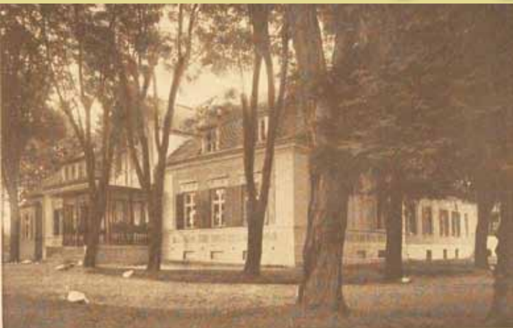
Prewentorium. — Ustronie. — Budynek zakładowy.