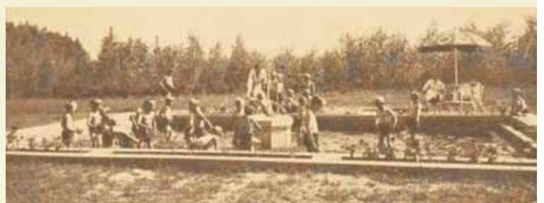
Prewentorium. — Ustronie. — Zabawa przy fontannie.