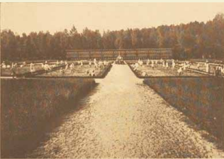
Prewentorium. — Ustronie. — Praca w ogrodzie.

„Białym Raju” wynosił 7 zł za dobę, przy czym 75% tej kwoty ponosiło państwo, a 25% – rodzice dziecka. Jednak ze względu na to, że kwota ponoszona przez państwo wystarczała na pokrycie kosztów utrzymania