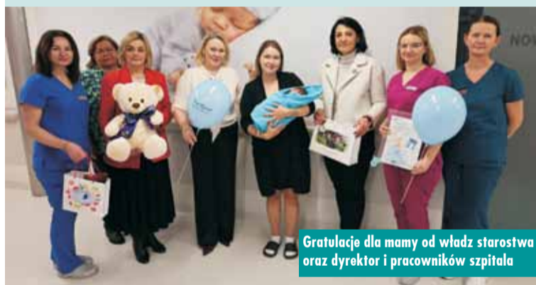
Gratulacje dla mamy od władz starostwa oraz dyrektor i pracowników szpitala