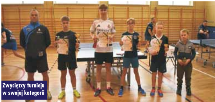
Zwycięzcy turnieju w swojej kategorii