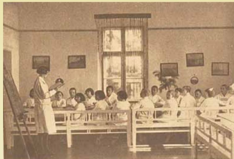
Prewentorium. — Ustronie. — Lekcja.

dziecka, minister Sławoj Składkowski zwolnił rodziców z wnoszenia opłat. Dzieci udające się na leczenie przywoziły ze sobą tylko: ubranie na