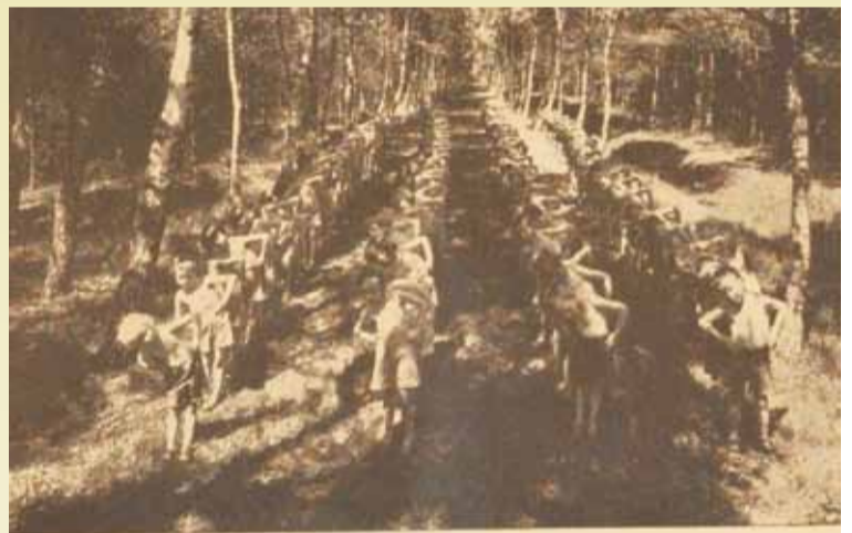
Prewentorium. — Ustronie. — Gimnastyka.