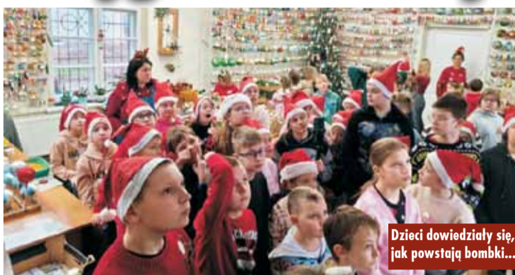
Dzieci dowiedziały się, jak powstają bombki...

niki tworzenia bombek oraz obserwowały proces ich zdobienia. Każde z nich miało też możliwość wykonania własnej, unikatowej bombki z imieniem. Wyjazd do Fabryki Bombek w Krośnicach okazał się wspaniałą inicjatywą, która nie tylko pozwoliła dzieciom aktywnie spędzić czas, ale również wzbogaciła ich wiedzę o sztuce rękodzieła i tradycjach świątecznych.