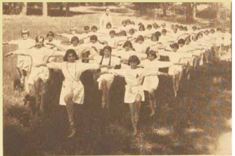
Prewentorium. — Ustronie. — Gimnastyka.