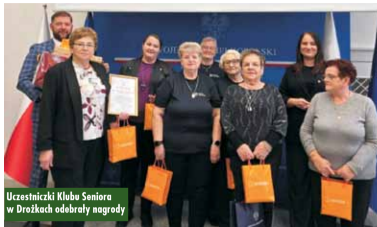
Uczestniczki Klubu Seniora w Drożkach odebrały nagrody