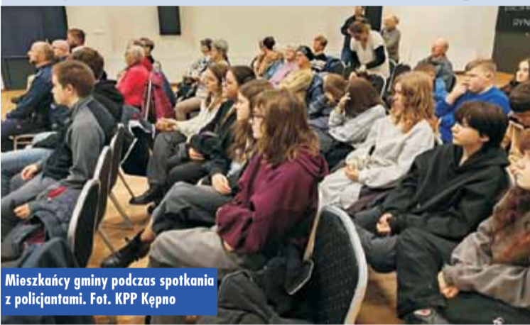
Mieszkańcy gminy podczas spotkania z policjantami.

Gminna Biblioteka Publiczna w Trzcinicy z kolejnym dofinansowaniem