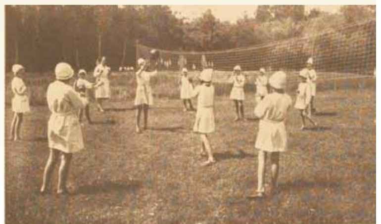
Prewentorium. — Ustronie. — Siatkówka.