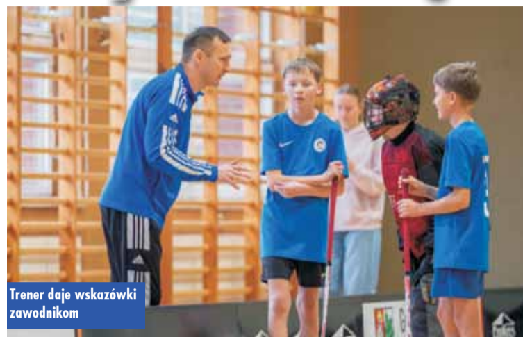
Trener daje wskazówki zawodnikom

2 grudnia br. w hali sportowej w Łęce Opatowskiej odbył się Półfinał Wojewódzki w Unihokeju Chłopców w ramach XXVII Igrzysk Dzieci 2025/2026. W rywalizacji uczestniczyły cztery szkoły z województwa wielkopolskiego: SP Rychwał, SP Radzewo, SP Kębłowo oraz Szkoła Podstawowa im. m. jra Stanisława Jeziornego w Łęce Opatowskiej – gospodarz turnieju. Mecze rozgrywano systemem „każdy z każdym”, w trzech tercjach po sześć minut. Zawody otworzyli: dyrektor szkoły