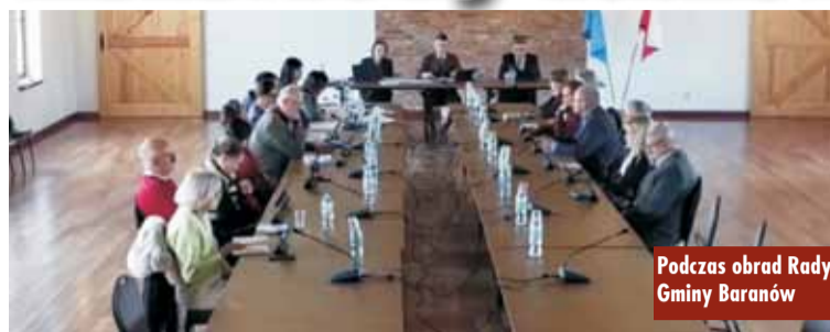
Podczas obrad Rady Gminy Baranów

30 grudnia 2025 r. w „Chacie Baranowskiej” odbyła się XVI sesja Rady Gminy Baranów, podczas której radni jednogłośnie przyjęli projekt budżetu na 2026 rok.