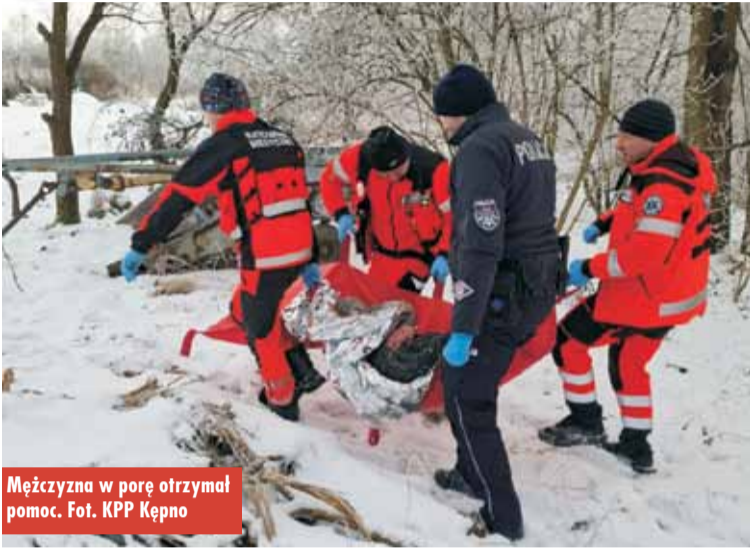
Mężczyzna w porę otrzymał pomoc.

Zima to bardzo trudny okres dla osób zmagających się z kryzysem bezdomności. Nocowanie w miejscach, które nie nadają się do przebywania, może okazać się niebezpieczne z uwagi na spadki temperatur.