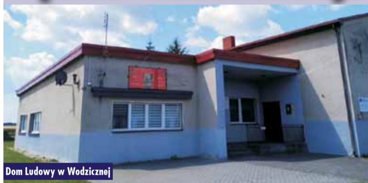
Dom Ludowy w Wodziejnej

18 grudnia 2025 r. zawarta została umowa o dofinansowanie projektu pt. „Dobudowa pomieszczeń toalet do istniejącego budynku Domu Ludowego w Wodziejnej” „Rozwój Lokalny Kierowany przez Społeczność (EFRR)” Działania „Wspieranie rozwoju programowego w Lokalnych Strategiach Rozwoju (RLKS)” Programu Fundusze Europejskie dla Wielkopolski 2021-2027. Umowa została zawarta pomiędzy Zarządem Województwa Wielkopolskiego działającym jako Instytucja Zarządzająca