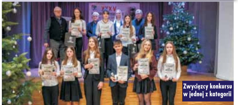
Zwycięzcy konkursu w jednej z kategorii

Zdarzenie drogowe w miejscowości Zgorzelec