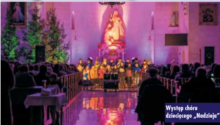
Występ chóru dziecięcego „Nadzieja”

11 stycznia br. w kościele pw. Miłosierdzia Bożego na Osiedlu Murator w Baranowie odbyło się wyjątkowe wydarzenie kulturalne pn. „Kolędowanie na Muratorze”. Koncert zgromadził licznych mieszkańców gminy, którzy przyszli wspólnie przeżyć jeszcze raz magię świątecznego czasu, wsłuchując się w tradycyjne kolędy i nastrojowe pastorałki.