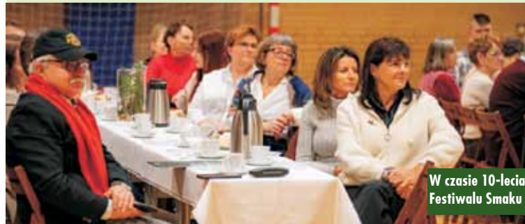
W czasie 10-lecia Festiwalu Smaku