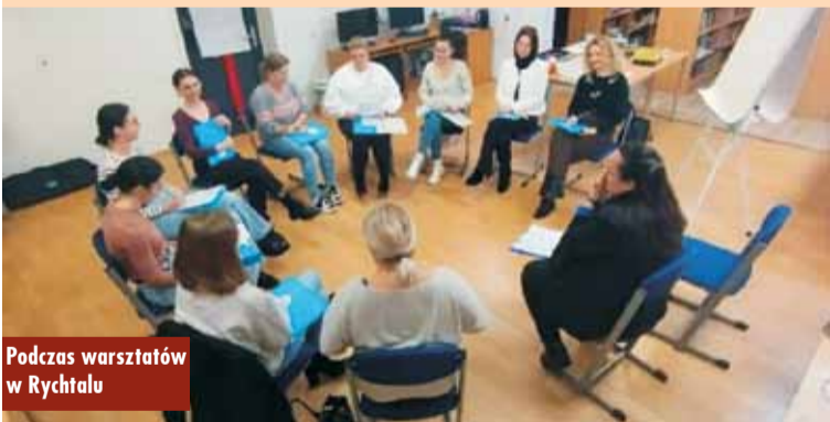
Podczas warsztatów w Rychtalu

zachęcania dzieci do współpracy z nami, a kolejne spotkania pozwoliły odpowiedzieć rodzicom na pytania, jak odnaleźć się w bogatym i jednocześnie trudnym świecie emocji dziecka, a przy okazji – swoim. Z tygodnia na tydzień uczestnicy odkrywali kolejne elementy, które nie tylko ułatwiały radzenie sobie z wyzwaniami codzienności oraz różnymi sytuacjami wychowawczymi, z jakimi mierzą się wszyscy rodzice świata, ale także sprzyjały głębszej refleksji nad własną postawą i relacją z dzieckiem.