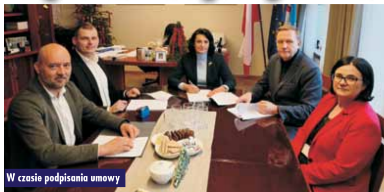
W czasie podpisania umowy

Nowy samochód dla Środowiskowego Domu Samopomocy