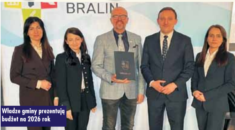
Władze gminy prezentują budżet na 2026 rok

17 grudnia ur. odbyła się XXIX sesja Rady Gminy Bralin, podczas której radni jednogłośnie podjęli uchwałę budżetową na 2026 rok.