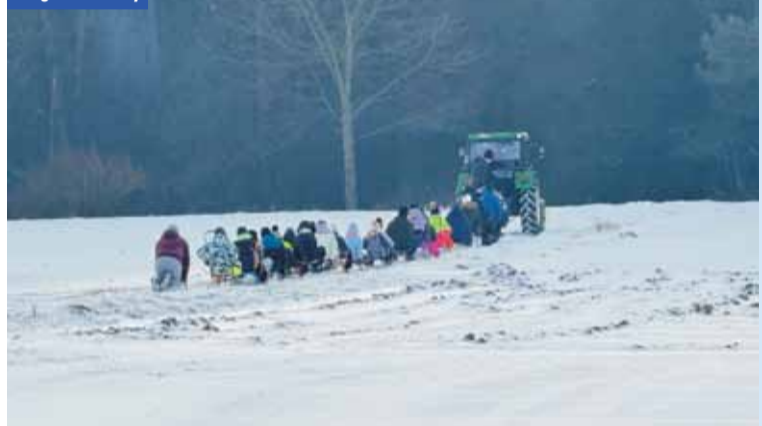
Kulig w Trzcinicy

służyły gałęzie z okolicznych drzew. Prawdziwy był tylko krążek, zakupiony w sklepie sportowym na Rynku. Jednak w gminie Trzcinica udało się zorganizować traktorowy kulig, ku wielkiej radości dzieci.