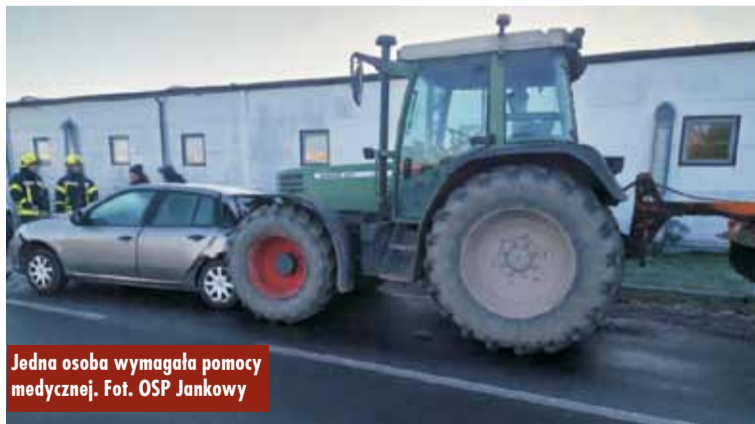
Jedna osoba wymagała pomocy medycznej.