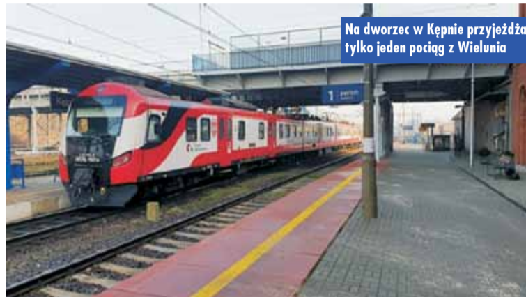
Na dworzec w Kępnie przyjeżdża tylko jeden pociąg z Wielunia

W liście pojawia się także postulat rozwijania tzw. połączeń stykowych, czyli na granicach województw. Zdaniem władarzy, linia nr 181 idealnie wpisuje się w taki model, bo łączy Śląsk, Ziemię Wieluńską i Wielkopolskę.