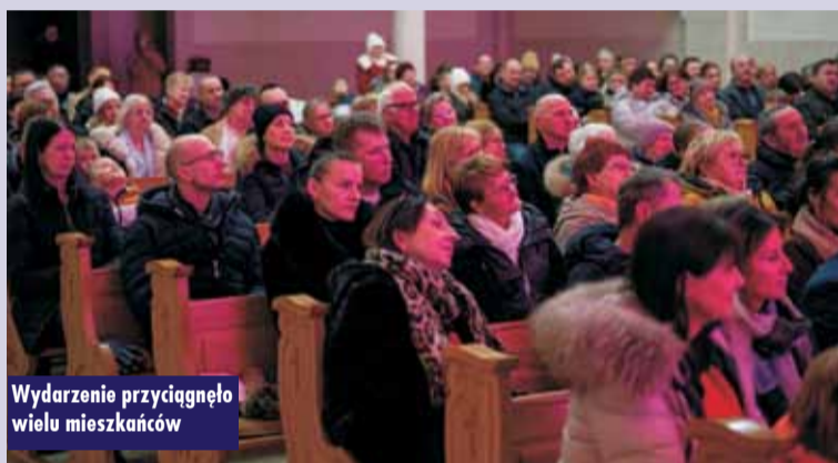
Wydarzenie przyciągnęło wielu mieszkańców