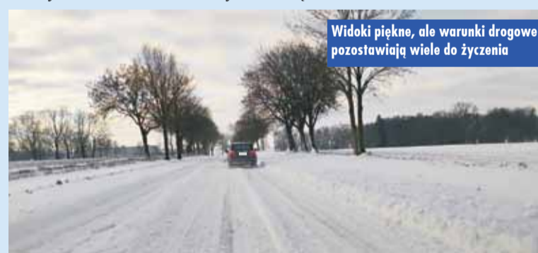
Widoki piękne, ale warunki drogowce pozostawiają wiele do życzenia

czaiły nas od minusowych temperatur. I nie chodzi tu o zagrażającą naszemu życiu hipotermię, ale także inne stany nagłe, które mogą nas zaskoczyć. W Polsce duże mrozy nie