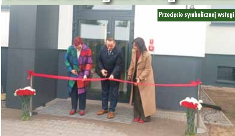
Przecięcie symbolicznej wstęgi

W Kępnie uroczystość otwarcia nowego budynku Powiatowego Inspektoratu Weterynarii – inwestycję o kluczowym znaczeniu dla bezpieczeństwa zdrowia zwierząt, nadzoru nad produkcją żywności oraz reagowania kryzysowego w powiecie kępińskim. Nowy obiekt zapewnia nowoczesne, funkcjonalne warunki pracy, dostosowane do rosnących zadań Inspekcji Weterynaryjnej oraz współczesnych standardów administracji publicznej.