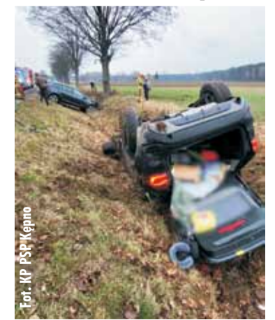
For. KP PSP Kępno