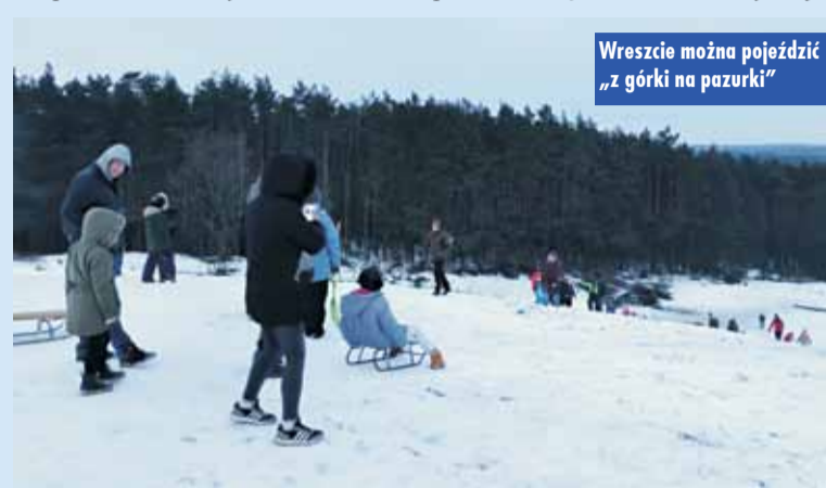
Wreszcie można pojeździć „z górki na pazurki”

uwagę należy zwrócić na ochronę głowy, szyi, dłoni i stóp – to właśnie przez te części ciała tracimy naj-