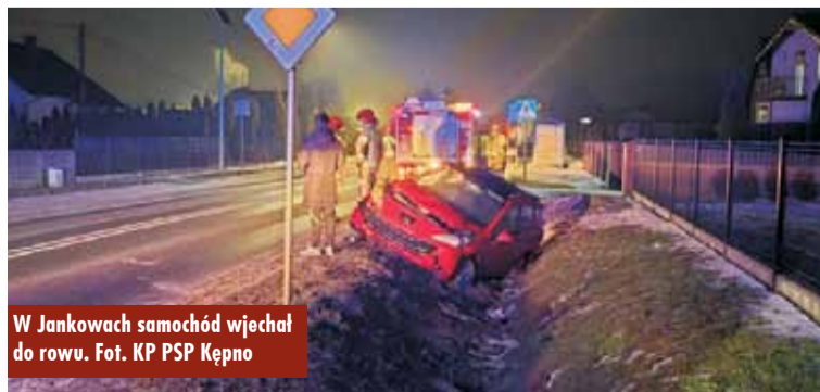
W Jankowach samochód wjechał do rowu.