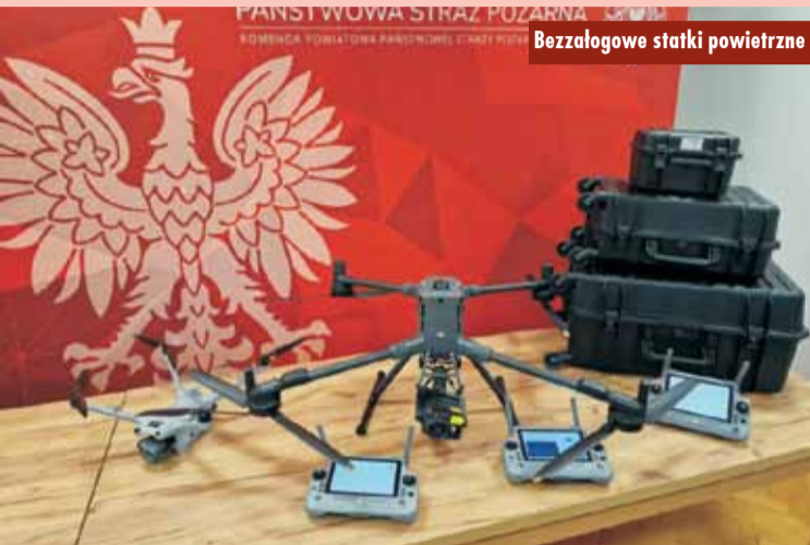
Bezzałogowe statki powietrzne

Massey Ferguson serii 5M o mocy 125 koni mechanicznych, wyposażony w ładowacz czołowy wraz z kompletem akcesoriów, a także przyczepę do transportu Humbaur 106224 BS Tandem-Hochlader Tieflader.