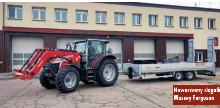
Nowoczesny ciągnik Massey Ferguson

Łączna wartość zakupu wyniosła 566 000 zł. Inwestycja została sfinansowana w ramach Programu Ochrony