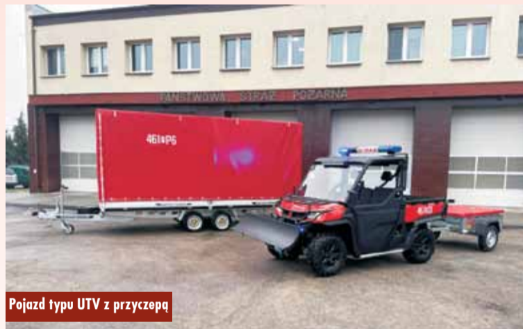
Pojazd typu UTV z przyczepą

Ciągnik Massey Ferguson 5M to wszechstronna i niezawodna maszyna, przystosowana do pracy w różnorodnych warunkach. Zastosowany ładowacz czołowy z akcesoriami umożliwi sprawne wykonywanie prac załadunkowych i rozładunkowych, usuwanie przeszkód powstałych w wyniku zdarzeń losowych i