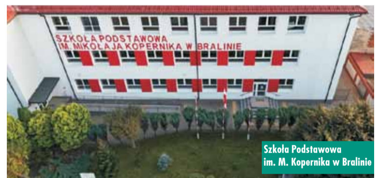
Szkoła Podstawowa im. M. Kopernika w Bralinie