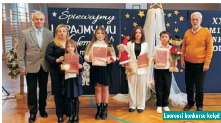
Laureaci konkursu kolęd

Warsztaty artystyczne z okazji Dnia Babci i Dziadka w baranowskiej bibliotece