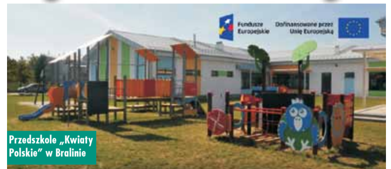
Przedszkole „Kwiaty Polskie” w Bralinie

Gmina Bralin pozyskała dofinansowanie na realizację dwóch projektów edukacyjnych z Funduszy Europejskich dla Wielkopolski 2021-2027, Priorytet 09: Rozwój Lokalny Kierowany przez Społeczność, Działanie 09.02: Edukacja przedszkolna, ogólna oraz kształcenie zawodowe w ramach rozwoju lokalnego.