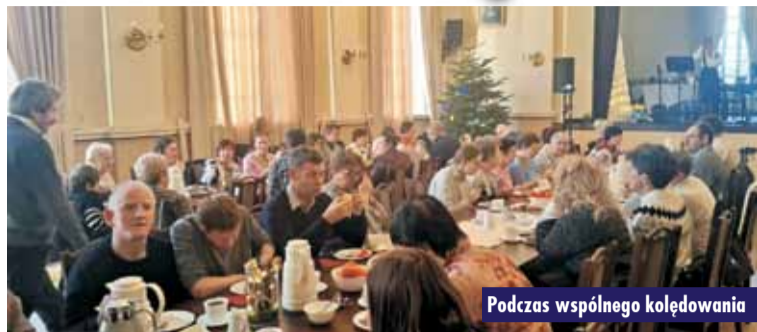
Podczas wspólnego kołędowania

20 stycznia br. w Domu Katolickim w Kępnie odbyło się tradycyjne kołędowanie zorganizowane przez Środowiskowy Dom Samopomocy w Kępnie.