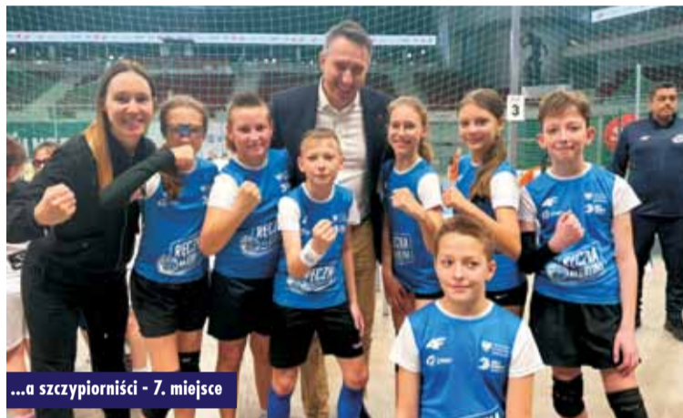
...a szczypiorniści - 7. miejsce

Dla obu drużyn była to piękna, sportowa przygoda, którą zawodnicy z pewnością zapamiętają na całe życie oraz spełnienie marzeń młodych sportowców i duma dla naszego regionu, który zawodnicy z zapałem reprezentowali. Gratulujemy i życzymy kolejnych sukcesów! KR