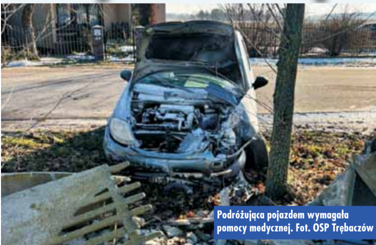
Podróżująca pojazdem wymagała pomocy medycznej.

19 stycznia br., kilka minut po godzinie 13.00, do Stanowiska Kierownika Komendanta Powiatowej Straży Pożarnej w Kępnie wpłynęło zgłoszenie o zdarzeniu drogowym w Trębaczowie. Na miejsce zdarzenia zadysponowano zastępy z Jednostki Ratowniczo-Gaśniczej w Kępnie i OSP Trębaczów. Po dotarciu na miejsce stwierdzono, że samo-