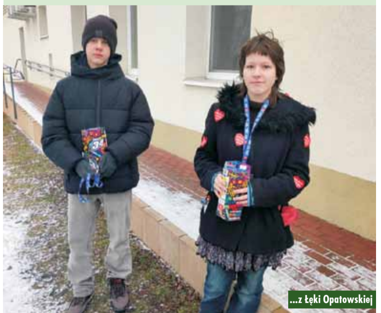
...z Łęki Opatowskiej

Drodzy Czytelnicy, „Tygodnik Kępiński” można znaleźć także w internecie. Serdecznie zapraszamy na stronę www.tygodnikkepinski.pl oraz na Facebook pod adres www.facebook.com/tygodnikkepinski