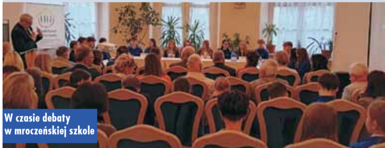
W czasie debaty w mroczeńskiej szkole