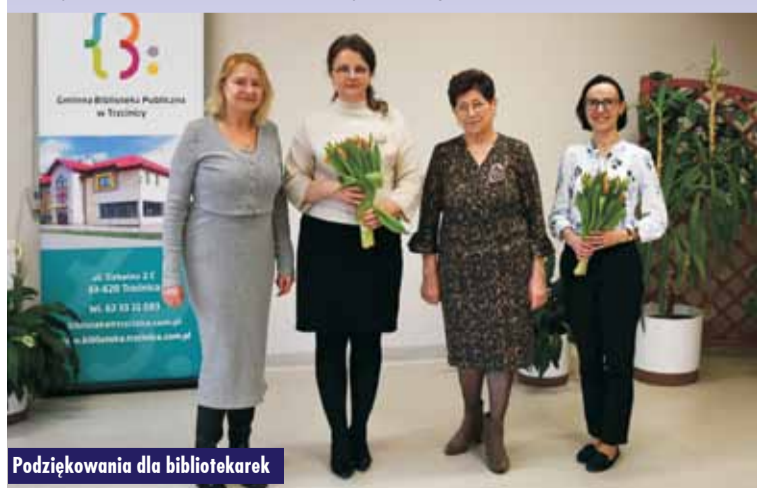
Podziękowania dla bibliotekarek