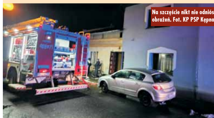
Na szczęście nikt nie odniósł obrażeń.

oraz Ochotniczej Straży Pożarnej w Kępnie. Po przybyciu strażacy stwierdzili pożar drewnianej podłogi w mieszkaniu na pierwszym piętrze