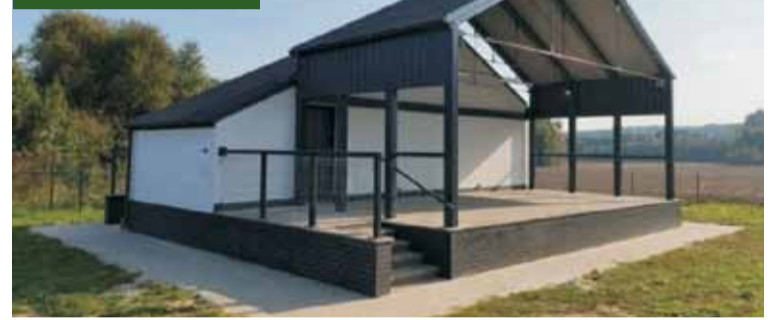
Wizualizacja sceny, która stanie na bralińskim stadionie

W ciągu najbliższych tygodni zostanie podpisana umowa z wykonawcą inwestycji, który został wyłoniony w konkursie przetargowym, w związku z czym w marcu możliwe jest rozpoczęcie budowy. Oprac. KR