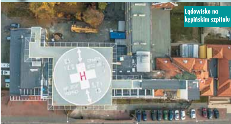
Lądowisko na kępińskim szpitalu

Obecna infrastruktura, znajdująca się na dachu szpitala, przestanie wkrótce odpowiadać aktualnym normom Lotniczego Pogotowia Ratunkowego. Lądowisko na dachu kępińskiego szpitala wybudowano w 2017 r. za kwotę 2,8 mln zł, a szacowany koszt modernizacji wyniesie ponad 3,9 mln zł. - Środki są zagwarantowane z Funduszu Medycznego. 97% inwestycji pokryje Ministerstwo Zdrowia, a tylko 3% będzie wkładu własnego. Przygotowujemy już stosowną dokumentację inwestycji – poinformowała Andżelika Moździanowska , dyrektor szpitala w Kępnie.