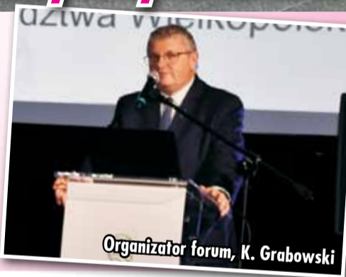
Organizator forum, K. Grabowski

Za nami II Samorządowe Forum Kół Gospodyń Wiejskich Powiatu Kępińskiego. Spotkanie zainicjowane przez wicemarszałka województwa wielkopolskiego Krzysztofa Grabowskiego odbyło się w Kępnie i było okazją do zaprezentowania ogromnego potencjału kobiet mieszkających na terenach wiejskich. ➔ str. 5