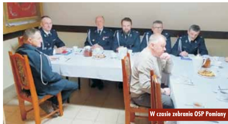
W czasie zebrania OSP Pomiany

Gmina Trzcinnica zawarła umowę z samorządem wojewódzkim na dofinansowanie infrastruktury sportowej