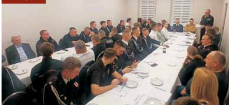
Podczas zebrania w OSP Kępno