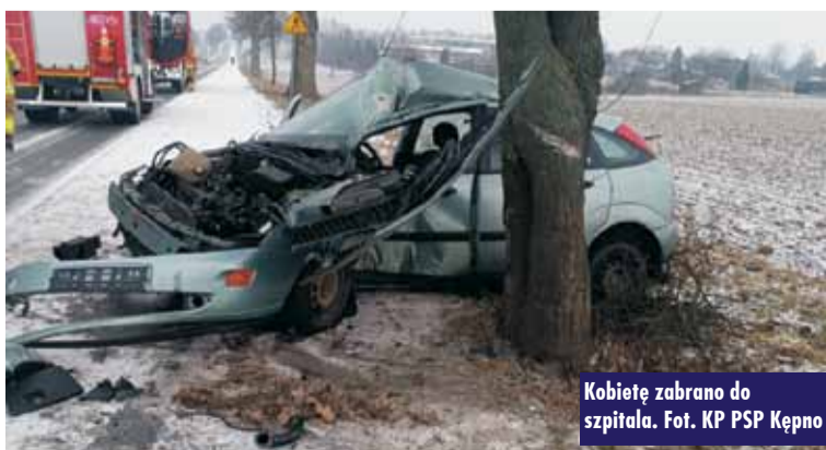
Kobietę zabrano do szpitala.

Po przybyciu na miejsce strażacy stwierdzili, że samochód osobowy