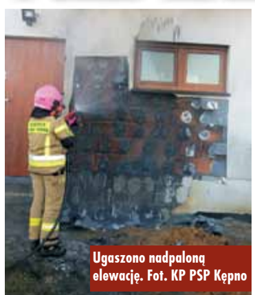
Ugaszono nadpaloną elewację.

7 marca br., około godz. 6.40, Stanowisko Kierowania Komendanta Powiatowej Państwowej Straży Pożarnej w Kępnie otrzymało zgłoszenie o pożarze przy ul. Bukowej w Łęce Opatowskiej.