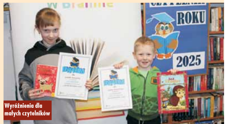
Wyróżnienia dla małych czytelników