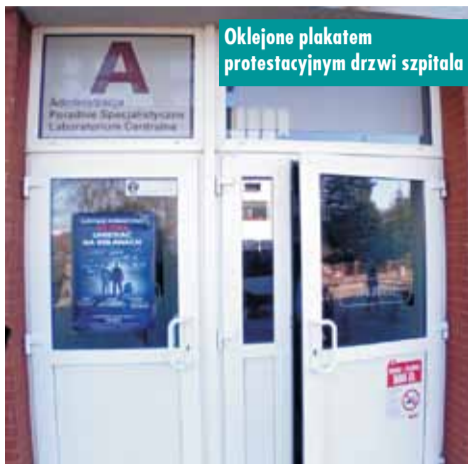
Oklejone plakatem protestacyjnym drzwi szpitala

Zapewniają powszechny dostęp do leczenia, w tym SOR i opiekę całodobową. Dla lokalnych społeczności