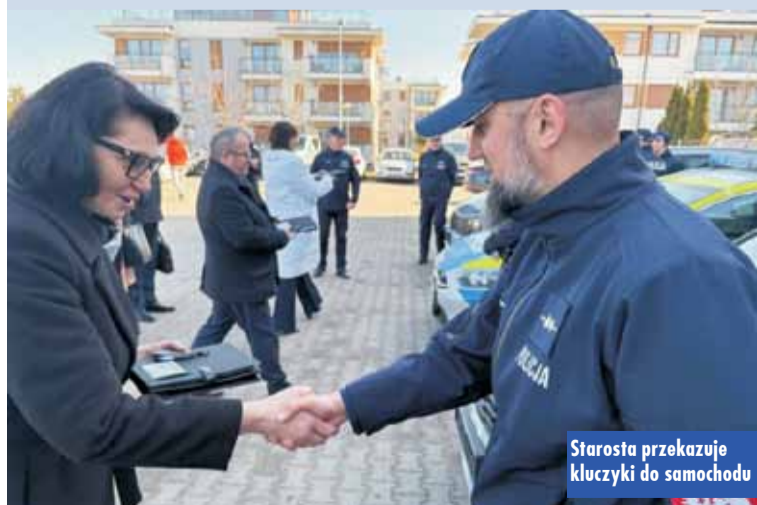
Starosta przekazuje kluczyki do samochodu

łym przełożeniu. Dzięki niej samochody te mają być szczególnie przydatne podczas działań prowadzonych na terenie aglomeracji miejskiej.