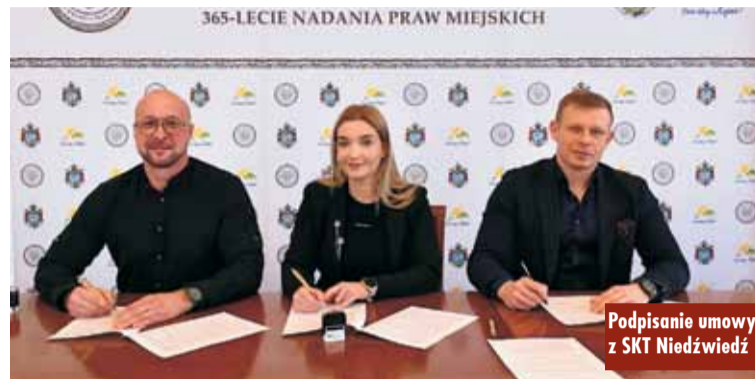
Podpisanie umowy z SKT Niedźwiedź

Wspieraniem i upowszechnianiem kultury fizycznej poprzez prowadzenie treningu pływackiego i rywalizację sportową zajmie się Uczniowski Klub Pływacki „Torpeda Qarium Kępno”, który uzyskał dotację w wysokości 10 000 zł.