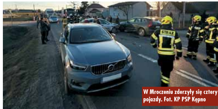
W Mroczeniu zderzyły się cztery pojazdy.

byli na miejsce strażacy zastali płonące drewno zmagazynowane na palecie, które wywiezione zostało z pomieszczenia kotłowni. - Stra-