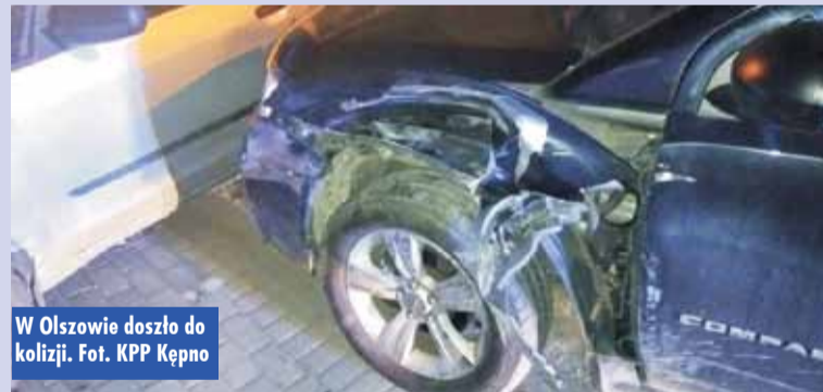
W Olszowie doszło do kolizji.

Kobieta będąca sprawcą kolizji za nieprawidłowy manewr została ukarana mandatem i punktami karnymi.