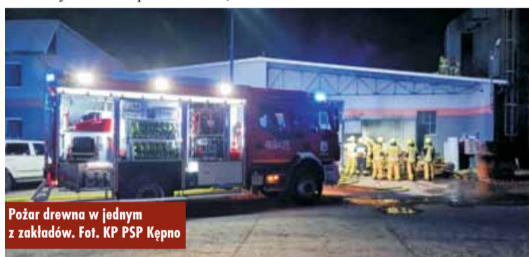
Pożar drewna w jednym z zakładów.

odnotowano osób poszkodowanych. - Działania straży pożarnej polegały na zabezpieczeniu miejsca zdarzenia, ograniczeniu wycieków płynów eksploatacyjnych z uszkodzonych pojazdów oraz szczegółowym