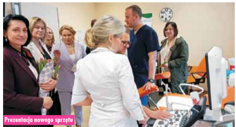
Prezentacja nowego sprzętu

Po przekazaniu radiowozów w kępińskiej komendzie odbyła się odprawa roczna, podsumowująca stan bezpieczeństwa na terenie powiatu kępińskiego oraz efekty pracy funkcjonariuszy KPP Kępno w minionym roku. Komendant powiatowy Policji w Kępnie podziękował obecnym na odprawie przedstawicielom samorządu za zaangażowanie w sprawę bezpieczeństwa oraz za bardzo dobrą współpracę z tutejszą jednostką policji. Oprac. m