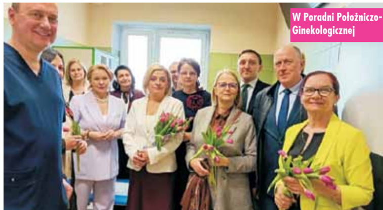
W Poradni Położniczo-Ginekologicznej

Tym razem w trakcie otwarcia nie przecinano wstęgi, ale starosta, dyrektor szpitala i kierownicy poradni rozwiązali symboliczną kokardę.